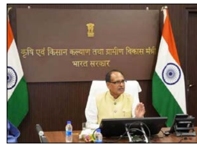
ಕರ್ನಾಟಕ ರಾಜ್ಯ ಸರ್ಕಾರ ಸಲ್ಲಿಸಿದ್ದ ಪ್ರಸ್ತಾವನೆಗೆ ಸ್ವಂದಿಸ್ವರದ ಕೇಂದ್ರ ಸಚಿವರು, ರಾಜ್ಯದಲ್ಲಿ 2025-26 ರಲ್ಲಿ ಋತುವಿನ ಕುಸುಮ್ ಬೆಳೆಯನ್ನು ಬೆಂಬಲ ಬೆಲೆಯಲ್ಲಿ ಖರೀದಿಸಲು ಅನುಮೋದಿಸಿದ್ದಾರೆ.

ನವದೆಹಲಿ ಕೇಂದ್ರ ಕೃಷಿ ಮತ್ತು ರೈತ ಕಲ್ಯಾಣ ಸಚಿವ ಶಿವರಾಜ್ ಸಿಂಗ್ ಔಪಚಾರ್ ಅವರು ಕರ್ನಾಟಕ, ಹರಿಯಾಣ ಮತ್ತು ಉತ್ತರ ಪ್ರದೇಶ ರಾಜ್ಯಗಳಲ್ಲಿ 2025-26 ರಲ್ಲಿ ಋತುವಿನ ಬೆಳೆಗಳನ್ನು ಕನಿಷ್ಠ ಬೆಂಬಲ ಬೆಲೆ ಅಡಿಯಲ್ಲಿ ಖರೀದಿಸಲು ಹಸಿರು ನಿಶಾನೆ ತೋರಿದ್ದಾರೆ. ಈ ನಿರ್ಧಾರದಿಂದ ಒಟ್ಟು 11,698 ಕೋಟಿ ರೂ. ಮೌಲ್ಯದ 18 ಲಕ್ಷ ಮೆಟ್ರಿಕ್ ಟನ್ ಗೂ ಅಧಿಕ ದ್ವಿಧನ ಧಾನ್ಯ ಮತ್ತು ಎಣ್ಣೆಬೀಜಗಳನ್ನು ಬೆಲೆ ಬೆಂಬಲ ಯೋಜನೆ ಅಡಿಯಲ್ಲಿ ಸಂಗ್ರಹಿಸಲಾಗುತ್ತದೆ.