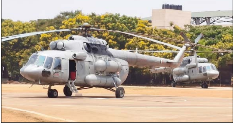
ತುಮಕೂರಿನ ಸಿದ್ದಗಂಗಾ ಮಠದಲ್ಲ ಏ. 1ರಂದು ನಡೆಯಲಿರುವ ಅಂಗೈಕ್ಯ ಡಾ. ಶ್ರೀ ಶಿವಕುಮಾರ ಸ್ವಾಮೀಜಿಯವರ 119ನೇ ಜಯಂತಿ ಹಾಗೂ ಗುರುವಂದನಾ ಮಹೋತ್ಸವದಲ್ಲ ಭಾಗಿಯಾಗಲು ರಾಷ್ಟ್ರಪತಿ ದೌಪತಿ ಮುರ್ಮು ಅವರು ಅಗಮಿಸುತ್ತಿರುವ ಓನ್ಲೈನಲ್ಲಿ ವಿಶ್ವವಿದ್ಯಾನಿಲಯದ ಅಪರಣದಲ್ಲಿರುವ ಹೆಲಿಕ್ಯಾಪ್ಟರ್‌ನಲ್ಲಿ ರಕ್ತದಾನ ಇಲಾಖೆಯ ಹೆಲಿಕಾಪ್ಟರ್‌ಗಳು ಲಿಪ್‌ಸೆಲ್ ನಡೆಸಲಿವೆ.