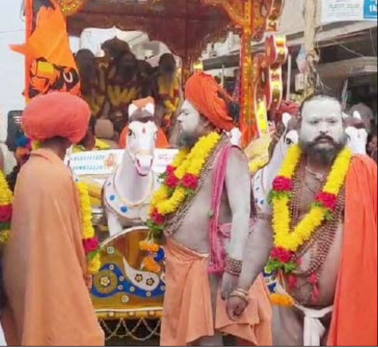
ಮುಳಬಾಗಿಲು ತಾಲ್ಲೂಕಿನ ಪ್ರಸಿದ್ಧ ಹಾಗೂ ಐತಿಹಾಸಿಕ ವಿರೂಪಾಕ್ಷ ದೇವಾಲಯದಲ್ಲಿ ಲೋಕ ಕಲ್ಯಾಣಾರ್ಥವಾಗಿ ಹಮ್ಮಿಕೊಳ್ಳಲಾಗಿರುವ ಏಳು ದಿನಗಳ 'ಕಾಲ ಶ್ರೀ ರುದ್ರ ಮಹಾಯಜ್ಞಕ್ಕೆ' ಸೋಮವಾರ ಅದ್ವೈತ ಚಾಲನೆ ದೊರೆಯಿತು. ಹಿಂದೂ ಸನಾತನ ಸಮಿತಿ ಹಾಗೂ ಸ್ಥಳೀಯರ ಸಹಯೋಗದೊಂದಿಗೆ ಆಯೋಜಿಸಲಾಗಿರುವ ಈ ಯಾಗದ ಅಂಗವಾಗಿ ಹತ್ತಾರು ನಾಗ ಸಾಧುಗಳು ನಡೆಸಿದ ತೋಫಾಯಾತ್ರೆಯ ಸಾರ್ವಜನಿಕ ಗಮನ ಸೆಳೆಯಿತು. ನಗರದ ಮುತ್ಯಾಪಣಿ ಗಂಗಮ್ಮ ದೇವಾಲಯದಲ್ಲಿ ವಿಶೇಷ ಪೂಜೆ ಸಲ್ಲಿಸುವ ಮೂಲಕ ತೋಫಾಯಾತ್ರೆಯ ಚಾಲನೆ ನೀಡಲಾಯಿತು. ಕುಂಭಮೇಳದಂತಹ ವಿಶೇಷ ಸಂದರ್ಭಗಳಲ್ಲಿ ಮಾತ್ರ ಕಾಣಿಸುವ ನಾಗ ಸಾಧುಗಳು ಮುಳಬಾಗಿಲಿನ ಬೀದಿಗಳಲ್ಲಿ ಸಂಚರಿಸಿದ್ದು ಭಕ್ತರಲ್ಲಿ ಕುತೂಹಲ ಮತ್ತು ಭಕ್ತಿ ಮೂಡಿಸಿತು. ಮಹಿಳೆಯರು ಪೂರ್ಣಕುಂಭ ಕಳಸಗಳೊಂದಿಗೆ ನಾಗ ಸಾಧುಗಳನ್ನು ಸ್ವಾಗತಿಸಿ, ಅಶೀರ್ವಾದ ಪಡೆದರು. ಕಠಿಣ ನಿಯಮಗಳು ಮತ್ತು ವಿಶಿಷ್ಟ ಜೀವನಶೈಲಿಗೆ ಹೆಸರಾದ ನಾಗ ಸಾಧುಗಳ ಉಪಸ್ಥಿತಿಯು ಈ ಮಹಾಯಜ್ಞಕ್ಕೆ ವಿಶೇಷ ಮೆರುಗು ನೀಡಿದೆ. ಅಸ್ತವ್ಯಸ್ತ ಕೂದಲು ಮತ್ತು ಭ್ರಷ್ಟಾರಿತ ದೇಹದೊಂದಿಗೆ ಕಾಣಿಸಿಕೊಳ್ಳುವ ಇವರು, ದೈವಿಕ ಶಕ್ತಿಯ ಆಧಾರಗಳಿದ್ದು, ದೀಕ್ಷೆ ಪಡೆದ ನಂತರ ಅತ್ಯಂತ ಶಿಸ್ತುಬದ್ಧ ಹಾಗೂ ಕಠಿಣ ದೈನಂದಿನ ಕಾರ್ಯಗಳನ್ನು ಪಾಲಿಸುತ್ತಾರೆ. ಲೋಕದ ಒಳಿತಿಗಾಗಿ ವಿರೂಪಾಕ್ಷ ಕ್ಷೇತ್ರದಲ್ಲಿ ನಡೆಯಲಿರುವ ಈ ಮಹಾಯಾಗದಲ್ಲಿ ಇವರು ಭಾಗವಹಿಸುತ್ತಿರುವುದು ಭಕ್ತರ ಪಾಲಿಗೆ ವಿಶೇಷ ಸಂದರ್ಭವಾಗಿದೆ. ಮುಂದಿನ ಏಳು ದಿನಗಳ ಕಾಲ ಕ್ಷೇತ್ರದಲ್ಲಿ ವಿವಿಧ ಧಾರ್ಮಿಕ ವಿಧಿವಿಧಾನಗಳು ಜರುಗಲಿವೆ.