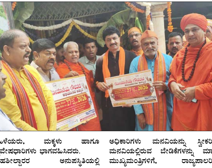
ಮಹಿಳೆಯರು, ಮಕ್ಕಳು ಹಾಗೂ ಅಧಿಕಾರಿಗಳು ಮನವಿಯನ್ನು ಸ್ವೀಕರಿಸಿ, ಕೃಷ್ಣವೇಷಧಾರಿಗಳು ಭಾಗವಹಿಸಿದರು. ತಹಶೀಲ್ದಾರರ ಅನುಪಸ್ಥಿತಿಯಲ್ಲಿ ಮುಖ್ಯಮಂತ್ರಿಗಳಿಗೆ, ರಾಜ್ಯಪಾಲರಿಗೆ,