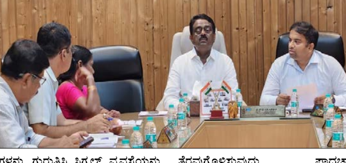
ಸ್ಥಳಗಳನ್ನು ಗುರುತಿಸಿ ಸಿಗ್ನಲ್ ವ್ಯವಸ್ಥೆಯನ್ನು ಸುಧಾರಿಸುವುದು, ಟೋಯಿಂಗ್ ವಾಹನಗಳ ಕಾರ್ಯಾಚರಣೆಯನ್ನು ಪರಿಣಾಮಕಾರಿಯಾಗಿ ನಡೆಸುವುದು ಹಾಗೂ ಕಸದ ಸಮಸ್ಯೆ ನಿರ್ವಹಣೆಗೆ ಹೆಚ್ಚಿನ ಆದ್ಯತೆ ನೀಡುವಂತೆ ಆಯುಕ್ತರು ತಿಳಿಸಿದರು. ವಿನ್ಯಾಟ್ ದೀಪಗಳ ನಿರ್ವಹಣೆ, ಪಾರ್ಕಿಂಗ್ ಸಂರಕ್ಷಣೆ, ಕುಡಿಯುವ ನೀರು ಮತ್ತು ಶೌಚಾಲಯ ಸೌಲಭ್ಯಗಳ ಸುಧಾರಣೆಗೂ ಗಮನ ಹರಿಸಲು ಸೂಚಿಸಲಾಯಿತು. ಅನಧಿಕೃತ ಫ್ಲೆಕ್ಸ್ ಹಾಗೂ ಬ್ಯಾನರ್‌ಗಳನ್ನು ತೆರವುಗೊಳಿಸುವುದು, ಪಾದಚಾರಿ ಮಾರ್ಗಗಳ ಮೇಲಿನ ಅನಧಿಕೃತ ಮಳಿಗೆಗಳನ್ನು ತೆರವುಗೊಳಿಸುವುದು ಹಾಗೂ ಹೊಸ ಅಪಾರ್ಟ್‌ಮೆಂಟ್ ಪ್ರದೇಶಗಳಲ್ಲಿ ಇ-ಸಾವಾತ ಮೇಳಗಳನ್ನು ಆಯೋಜಿಸುವ ಬಗ್ಗೆ ನಿರ್ದೇಶನ ನೀಡಲಾಯಿತು. ಮಳೆಗಾಲದ ಮುಂಚಾಗುತ್ತಾ ಕ್ರಮಗಳನ್ನು ಕೈಗೊಳ್ಳಲು ಹಾಗೂ ಯಾವುದೇ ಅನಾಹಾರಗಳ ಸಂಭವಿಸದಂತೆ ಮುನ್ನೆಚ್ಚರಿಕೆ ಕ್ರಮಗಳನ್ನು ಅನುಸರಿಸಲು ಸೂಚಿಸಲಾಯಿತು. ಚೋಕ್‌ನಂದ್ರ ಕೆರೆಯ ಅಭಿವೃದ್ಧಿಗೆ ಆದ್ಯತೆ