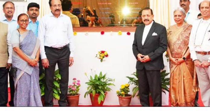
ಇದು ಮಹತ್ವದ ಹೆಜ್ಜೆಯಾಗಿದೆ ಎಂದು ಸಚಿವರು ಹೇಳಿದರು. ಸಚಿವರು ಮಾತನಾಡುತ್ತಾ, ಬಾಹ್ಯಾಕಾಶ, ರಕ್ಷಣಾ ಹಾಗೂ ಅಂತರರಾಷ್ಟ್ರೀಯ ವಲಯಗಳಲ್ಲಿ ಬಳಕೆಯಾಗುತ್ತಿರುವ ಸುಧಾರಿತ ಖಗೋಳ ಉಪಕರಣಗಳಲ್ಲಿ ಭಾರತದ ಸ್ಥಳೀಯ ತಂತ್ರಜ್ಞಾನ ಸಾಮರ್ಥ್ಯವನ್ನು ಸಂಪೂರ್ಣವಾಗಿ ಬಳಸಿಕೊಳ್ಳಲಾಗುತ್ತಿದೆ ಎಂದು ತಿಳಿಸಿದರು. ಐ.ಐ.ಎ.ಯಲ್ಲಿ ಅಭಿವೃದ್ಧಿಪಡಿಸಲಾದ ತಂತ್ರಜ್ಞಾನಗಳನ್ನು ಇನ್ನೂ ಸೇರಿದಂತೆ ಹಲವು ರಾಷ್ಟ್ರೀಯ ಮತ್ತು ಅಂತರರಾಷ್ಟ್ರೀಯ ಬಾಹ್ಯಾಕಾಶ ಕಾರ್ಯಾಚರಣೆಗಳಲ್ಲಿ ಬಳಸಲಾಗುತ್ತಿದೆ ಎಂದು

ಬೆಂಗಳೂರು ಭಾರತೀಯ ಖಗೋಳ ಭೌತಶಾಸ್ತ್ರ ಸಂಸ್ಥೆ (ಐ.ಐ.ಎ.)ಯಲ್ಲಿ 75 ಕೋಟಿ ವೆಚ್ಚದ ಅತ್ಯಾಧುನಿಕ ಹೊಸ ಹೆಚ್ಚುವರಿ ಕಟ್ಟಡಕ್ಕೆ ಕೇಂದ್ರ ಸಚಿವರಾದ ಡಾ. ಚೇಂದ್ರ್ ಸಿಂಗ್ ಶಂಕುಸ್ಥಾಪನೆ ನೆರವೇರಿಸಿದರು. ಕೋರಮಂಜಿಲ್ಲದಲ್ಲಿರುವ ಸಂಸ್ಥೆಯ ಆವರಣದಲ್ಲಿ ನಡೆದ ಈ ಕಾರ್ಯಕ್ರಮದಲ್ಲಿ ವಿಜ್ಞಾನಿಗಳು, ಸಂಶೋಧಕರು ಹಾಗೂ ವಿವಿಧ ಇಲಾಖೆಗಳ ಅಧಿಕಾರಿಗಳು ಉಪಸ್ಥಿತರಿದ್ದರು. ಈ ಸೂತನ ಕಟ್ಟಡವು ಏಳು ಅಂತಸ್ತಿನದಾಗಿದ್ದು, ಸುಮಾರು 60 ಬಂದಿ ಲಕ್ಷ ಚದರ ಅಡಿ ವಿಸ್ತೀರ್ಣದಲ್ಲಿ ನಿರ್ಮಾಣವಾಗಲಿದೆ. ದೇಶದ ಪ್ರಮುಖ ವೈಜ್ಞಾನಿಕ ಕೇಂದ್ರಗಳಲ್ಲಿ ಒಂದಾಗಿ ಇದನ್ನು ಅಭಿವೃದ್ಧಿಪಡಿಸಲಾಗುತ್ತಿದೆ. ಖಗೋಳಶಾಸ್ತ್ರ ಮತ್ತು ಖಗೋಳ ಭೌತಶಾಸ್ತ್ರ ಕ್ಷೇತ್ರದಲ್ಲಿ ಭಾರತದ ಸಾಮರ್ಥ್ಯವನ್ನು ಮತ್ತಷ್ಟು ಬಲಪಡಿಸುವ ಉದ್ದೇಶ ಹೊಂದಿದೆ. ವಿಶ್ವ ದರ್ಜೆಯ, ಭವಿಷ್ಯಮುಖ ಸಂಶೋಧನೆಗಳಿಗೆ