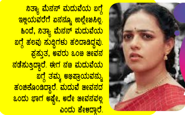
ನಿತ್ಯಾ ಮನಸ್ ಮದುವೆಯ ಬಗ್ಗೆ ಇಲ್ಲವೆಂದರೆ ಏನನ್ನೂ ಉಲ್ಲೇಖಿಸಿಲ್ಲ. ಹಿಂದೆ, ನಿತ್ಯಾ ಮನಸ್ ಮದುವೆಯ ಬಗ್ಗೆ ಹಲವು ಸುದ್ದಿಗಳು ಹರಿದಾಡಿತ್ತು. ಪ್ರಸ್ತುತ, ಅವರು ಒಂಟಿ ಜೀವನ ನಡೆಸುತ್ತಿದ್ದಾರೆ. ಈಗ ನಟಿ ಮದುವೆಯ ಬಗ್ಗೆ ತಮ್ಮ ಅಭಿಪ್ರಾಯವನ್ನು ಹಂಚಿಕೊಂಡಿದ್ದಾರೆ. ಮದುವೆ ಜೀವನದ ಒಂದು ಭಾಗ ಅಷ್ಟೇ, ಅದೇ ಜೀವನವಲ್ಲ ಎಂದು ಹೇಳಿದ್ದಾರೆ.