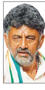
ಮುಕ್ತಾಯವಾಗಿದ್ದು, ನೀರಿನ ಶೇಖರಣೆ ಅರಂಭಿಸಬೇಕಿದೆ. ಇನ್ನು ಕಾವೇರಿ ನೀರಿನ ವಿಚಾರದಲ್ಲಿ 177 ಟಿಎಂಸಿ ನೀರು ಹಂಸಲೇಬೇಕು ಎಂದು ಸುಪ್ರೀಂ ಕೋರ್ಟ್ ಆದೇಶಿಸಿದೆ. ಈ ಕಾರಣಕ್ಕೆ ಮಳೆ ಚೆನ್ನಾಗಿ ಬರಲಿ ಎಂದು ನಾನು ದೇವರಲ್ಲಿ ಪ್ರಾರ್ಥನೆ ಮಾಡುತ್ತೇನೆ. ಹೆಚ್ಚಿನ ಮಳೆ ಬಂದರೆ ಅದನ್ನು ಎದುರಿಸಲು ಈಗಾಗಲೇ ಸಿದ್ಧತೆಯನ್ನು ಮಾಡಿಕೊಂಡಿದ್ದೇವೆ" ಎಂದು ಹೇಳಿದರು. ಅದಷ್ಟು ಬೇಗ ಅಧಿಕಾರ ಹಂಚಿಕೆ ಗೊಂದಲ ಬಗೆಹರಿಸುವಿರಾ, ಮಲ್ಟಿಕಾರ್ವನ್ ಖರ್ಗೆ ಅವರು ಬದಲಾವಣೆ ಇಲ್ಲ ಎಂದಿದ್ದಾರೆ ಎಂದು ಕೇಳಿದಾಗ, "ಗೊಂದಲವೇ ಇಲ್ಲ. ನೀವುಗಳು ಏನಿದ್ದರೂ ಮಲ್ಟಿಕಾರ್ವನ್ ಖರ್ಗೆ ಸಾಹೇಬರನ್ನು ಕೇಳಿ. ನಾಯಕತ್ವ ಬದಲಾವಣೆ ವಿಚಾರದಲ್ಲಿ ನಾನು ಯಾವುದೇ ಪ್ರತಿಕ್ರಿಯೆ ನೀಡುವುದಿಲ್ಲ. ಇದು ಸ್ವಲ್ಪ ಹೈಕಮಾಂಡ್ ಗೆ ಬಿಟ್ಟ ವಿಚಾರ ಅವರು ತೀರ್ಮಾನ ಮಾಡುತ್ತಾರೆ" ಎಂದರು.

ಅಧಿಕಾರಿಗಳಿಗೆ ತಿಳಿಸಿದ್ದೇನೆ." ಎಂದರು. "ಬೆಂಗಳೂರಿನ ಎಲ್ಲಾ ರಸ್ತೆಗಳಲ್ಲಿ ಇರುವ ದುರ್ಬಲ ಮರಗಳು, ಕೊಂಬೆಗಳನ್ನು ಕತ್ತರಿಸಲಾಗುವುದು. ಈಗಾಗಲೇ ಕೆಲಸ ಪ್ರಾರಂಭವಾಗಿದೆ. ಇದರ ಬಗ್ಗೆ ಪೊಲೀಸ್ ಹಾಗೂ ಬಿಬಿಎ ಅಧಿಕಾರಿಗಳು ಕೆಲಸ ಮಾಡಿ ಪಟ್ಟಿ ತಯಾರಿಸಿದ್ದಾರೆ. ಮಳೆಹಾನಿ ತಡೆಗೆ ಕಂಟ್ರೋಲ್ ರೂಮ್ ಸಹ ಆಣಿಯಾಗಿದೆ. ಅಧಿಕಾರಿಗಳು ಸಹ ಕಾರ್ಯಪ್ರವೃತ್ತರಾಗಿದ್ದಾರೆ" ಎಂದು ತಿಳಿಸಿದರು. ಹವಾಮಾನ ಇಲಾಖೆಯವರು ಈ ವರ್ಷ ಮಳೆ ಕಡಿಮೆ ಬರುತ್ತದೆ ಎಂದು ಹೇಳಿದ್ದಾರೆ. ಇದರಿಂದ ಆಣೆಕಟ್ಟುಗಳಲ್ಲಿ ನೀರಿನ ಪ್ರಮಾಣ ಕಡಿಮೆಯಾಗಲಿದೆ. ನಂತರ ವಿದ್ಯುತ್ ಉತ್ಪಾದನೆ ಕುಸಿಯಲಿದೆ. ನಾನು ನಾಡಿದ್ದು ತುಂಭಡ್ಡು ಜಲಾಶಯಕ್ಕೆ ಭೇಟಿ ನೀಡುತ್ತಿದ್ದೇನೆ. ಅಲ್ಲಿ ಎಲ್ಲಾ ಗೇಟ್ ಬದಲಿ ಕಾರ್ಯ