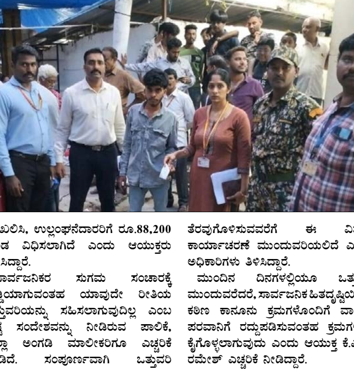
ದಾಖಲಿಸಿ, ಉಲ್ಲಂಘನೆದಾರರಿಗೆ ರೂ.88,200 ದಂಡ ವಿಧಿಸಲಾಗಿದೆ ಎಂದು ಆಯುಕ್ತರು ತಿಳಿಸಿದ್ದಾರೆ. ಸಾರ್ವಜನಿಕ ಸುಗಮ ಸಂಚಾರಕ್ಕೆ ಅಡ್ಡಿಯಾಗುವಂತಹ ಯಾವುದೇ ರೀತಿಯ ಒತ್ತುವರಿಯನ್ನು ಸಹಿಸಲಾಗುವುದಿಲ್ಲವೆಂದು ಸ್ಪಷ್ಟ ಸಂದೇಶವನ್ನು ನೀಡಿರುವ ಪಾಲಿಕೆ, ಎಲ್ಲಾ ಅಂಗಡಿ ಮಾಲೀಕರಿಗೂ ಎಚ್ಚರಿಕೆ ನೀಡಿದೆ. ಸಂಪೂರ್ಣವಾಗಿ ಒತ್ತುವರಿ ತೆರವುಗೊಳಿಸುವವರೆಗೆ ಈ ವಿಶೇಷ ಕಾರ್ಯಾಚರಣೆ ಮುಂದುವರಿಯಲಿದೆ ಎಂದು ಅಧಿಕಾರಿಗಳು ತಿಳಿಸಿದ್ದಾರೆ. ಮುಂದಿನ ದಿನಗಳಲ್ಲಿಯೂ ಒತ್ತುವರಿ ಮುಂದುವರೆದರೆ, ಸಾರ್ವಜನಿಕ ಹಿತದೃಷ್ಟಿಯಿಂದ ಕಠಿಣ ಕಾನೂನು ಕ್ರಮಗಳೊಂದಿಗೆ ವಾಣಿಜ್ಯ ಪರವಾನಿಗೆ ರದ್ದುಪಡಿಸುವಂತಹ ಕ್ರಮಗಳನ್ನು ಕೈಗೊಳ್ಳಲಾಗುವುದು ಎಂದು ಆಯುಕ್ತ ಕೆ.ಎನ್. ರಮೇಶ್ ಎಚ್ಚರಿಕೆ ನೀಡಿದ್ದಾರೆ.

ಬೆಂಗಳೂರು ದಕ್ಷಿಣ ನಗರ ಪಾಲಿಕೆ ವ್ಯಾಪ್ತಿಗೆ ಒಳಪಟ್ಟ ಜಯನಗರ ವಾಣಿಜ್ಯ ಸಂಕೀರ್ಣದಲ್ಲಿ ಒತ್ತುವರಿ ತೆರವು ಕಾರ್ಯಾಚರಣೆ ನಡೆಸಲಾಗಿದ್ದು, ಒಟ್ಟು 88,200 ದಂಡ ವಸೂಲಿ ಮಾಡಲಾಗಿದೆ ಎಂದು ಆಯುಕ್ತ ಕೆ.ಎನ್. ರಮೇಶ್ ತಿಳಿಸಿದ್ದಾರೆ. ಸುಮಾರು 15,000 ಚದರ ಅಡಿ ವಿಸ್ತೀರ್ಣ ಹೊಂದಿರುವ ಈ ಸಂಕೀರ್ಣದಲ್ಲಿ 270ಕ್ಕೂ ಹೆಚ್ಚು ಅಂಗಡಿಗಳು ಕಾರ್ಯನಿರ್ವಹಿಸುತ್ತಿದ್ದು, ಕಾರಿಡಾರ್‌ಗಳು, ಪಾದಚಾರಿ ಮಾರ್ಗಗಳು ಮತ್ತು ಸಾರ್ವಜನಿಕ ಸ್ಥಳಗಳನ್ನು ಅಂಗಡಿ ಮಾಲೀಕರು ಹಾಗೂ ವ್ಯಾಪಾರಿಗಳು ಅತಿಕ್ರಮಿಸಿಕೊಂಡಿರುವ ಬಗ್ಗೆ ಸಾರ್ವಜನಿಕರಿಂದ ಹಲವು ದೂರುಗಳು ಬಂದಿದ್ದವು. ಈ ಒನ್ನೆಲೆಯಲ್ಲಿ ಕಳೆದ ಮೂರು ದಿನಗಳಿಂದ ಪಾಲಿಕೆ ಅಧಿಕಾರಿಗಳು ಅಂಗಡಿ ಮಾಲೀಕರಿಗೆ ತಮ್ಮ ವ್ಯಾಪ್ತಿಯನ್ನು ಮೇಲೆ ನಿರೀಕ್ಷಿಸಿ ಒತ್ತುವರಿಯನ್ನು ಸ್ವಯಂಪ್ರೇರಿತವಾಗಿ ತೆರವುಗೊಳಿಸುವಂತೆ ಜಾಗೃತಿ ಮೂಡಿಸಿದ್ದರು. ಆದಾಗ್ಯೂ, ಸೂಚನೆಗಳ ನಂತರವೂ ಒತ್ತುವರಿ ಮುಂದುವರೆದ ಒನ್ನೆಲೆಯಲ್ಲಿ ಪಾಲಿಕೆಯಿಂದ ಕಠಿಣ ಕ್ರಮ ಕೈಗೊಳ್ಳಲಾಗಿದೆ. ಕಾರಿಡಾರ್ ಮತ್ತು ಪಾದಚಾರಿ ಮಾರ್ಗಗಳನ್ನು ಅತಿಕ್ರಮಿಸಿರುವ ಒನ್ನೆಲೆಯಲ್ಲಿ ಒಟ್ಟು 39 ಪ್ರಕರಣಗಳನ್ನು