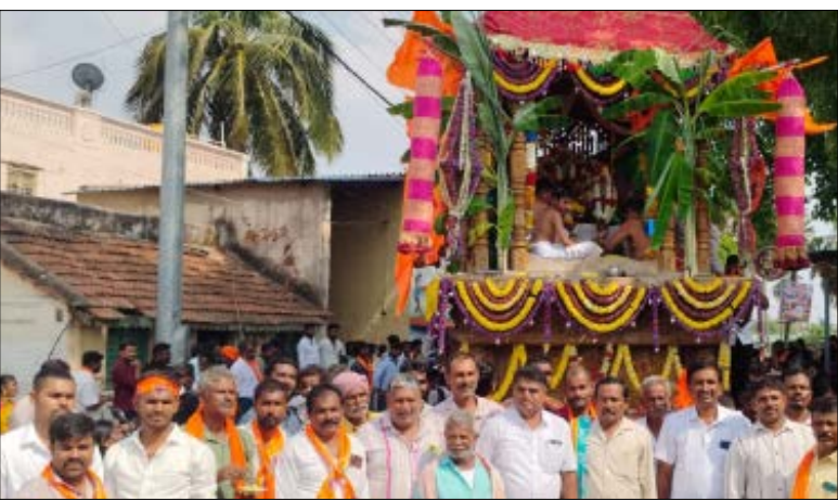
ಗ್ರಾಮಸ್ಥರು ಮಾತನಾಡಿ, "ರಾಮಸಾಗರ ನದಿಡಡದಲ್ಲಿ ನೆಲೆಸಿರುವ ಈ ದೇವಾಲಯದ

ಬ್ರಹ್ಮರಥೋತ್ಸವದ ಅಂಗವಾಗಿ ಬೆಳಗ್ಗೆಯಿಂದಲೇ ಸ್ವಾಮಿಗೆ ವಿಶೇಷ ಪೂಜೆ, ಪಂಚಾಮೃತ ಅಭಿಷೇಕ, ಪುಷ್ಪಾಲಂಕಾರ ಹಾಗೂ ಮಹಾಮಂಗಳಾರತಿ ನೆರವೇರಿಸಲಾಯಿತು. ರಥೋತ್ಸವಕ್ಕೂ ಮುನ್ನ ದೇವಾಲಯ ಆವರಣದಲ್ಲಿ ಹೋಮ ಹವನ ಸೇರಿದಂತೆ ವಿವಿಧ ಧಾರ್ಮಿಕ ವಿಧಿವಿಧಾನಗಳನ್ನು ತಾಸ್ತೋಕ್ತವಾಗಿ ನೆರವೇರಿಸಲಾಯಿತು.