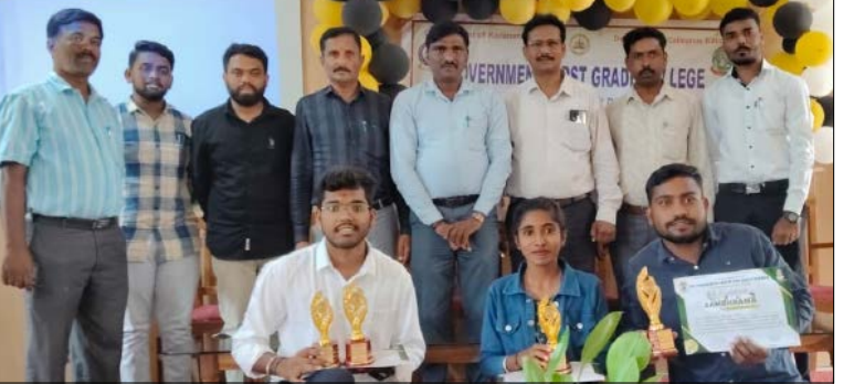
ಪತ್ರಿಕೆಗಳನ್ನು ಓದಿ, ವಿವಿಧ ಮೂಲಗಳಿಂದ ಮಾಹಿತಿ ಪರಿಶೀಲಿಸಿ ಸತ್ಯಾಸತ್ಯತೆ ತಿಳಿದುಕೊಳ್ಳಬೇಕು" ಎಂದು ಹೇಳಿದರು.

ನಗರದ ಸರ್ಕಾರಿ ಪ್ರಥಮ ದರ್ಜೆ ಕಾಲೇಜಿನಲ್ಲಿ ಪತ್ರಿಕೋದ್ಯಮ ವಿಭಾಗ ಹಾಗೂ ಈ ದಿನ ಡಾಟ್ ಕಾಂ ಸಹಯೋಗದಲ್ಲಿ "ಪ್ರಸ್ತುತ ವಿದ್ಯಮಾನಗಳಲ್ಲಿ ಡಿಜಿಟಲ್ ಮಾಧ್ಯಮಗಳ ಪಾತ್ರ" ವಿಷಯದ ಕುರಿತು ಎಚ್.ಟಿ.ಆರ್.ಎಲ್ ಕಲಾಂ ಸಭಾಂಗಣದಲ್ಲಿ ಗುರುವಾರ ಆಯೋಜಿಸಲಾದ ಕಾರ್ಯಾಗಾರವನ್ನು ಉದ್ಘಾಟಿಸಿ ಅವರು ಮಾತನಾಡಿದರು. "ಸಾಮಾಜಿಕ ಜಾಲತಾಣಗಳಲ್ಲಿ ಕಾಣಿಸುವ ಪ್ರತಿಯೊಂದು ಮಾಹಿತಿಯನ್ನು ನಂಬಬಾರದು.