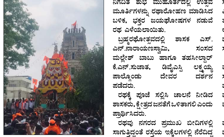
ನಿಗದಿತ ಶುಭ ಮುಹೂರ್ತದಲ್ಲಿ ಉತ್ಸವ ಮೂರ್ತಿಗಳನ್ನು ರಥಾರೋಹಣ ಮಾಡಿಸಿದ ಬಳಿಕ, ಭಕ್ತರ ಜಯಘೋಷಗಳ ನಡುವೆ ರಥ ಎಳೆಯಲಾಯಿತು.

ಬಿಂಠಾರವೇಟೆ ನಗರದ ಆರಾಧ್ಯ ದೈವ, ಐತಿಹಾಸಿಕ ಪ್ರಸಿದ್ಧ ಶ್ರೀ ಕೋಡಂಡರಾಮಸ್ವಾಮಿ ಬ್ರಹ್ಮರಥೋತ್ಸವವು ಶುಕ್ರವಾರ ಸಾವಿರಾರು ಭಕ್ತರ ಸಮ್ಮುಖದಲ್ಲಿ ಅತ್ಯಂತ ವೈಭವ ಹಾಗೂ ಧಾರ್ಮಿಕ ಶ್ರದ್ಧಾಭಕ್ತಿಗಳೊಂದಿಗೆ ನೆರವೇರಿತು. ರಥೋತ್ಸವದ ಅಂಗವಾಗಿ ಮುಂಜಾನೆಯಿಂದಲೇ ದೇವಾಲಯದಲ್ಲಿ ಸೀತಾ, ಲಕ್ಷ್ಮಣ ಸಮೇತ ಶ್ರೀ ಕೋಡಂಡರಾಮಸ್ವಾಮಿಗೆ ವಿಶೇಷ ಅಭಿಷೇಕ, ಹೋಮ-ಹವನ ಹಾಗೂ ಮಹಾಮಂಗಳಾರತಿ ಸೇರಿದಂತೆ ವಿವಿಧ ಧಾರ್ಮಿಕ ವಿಧಿವಿಧಾನಗಳನ್ನು ನೆರವೇರಿಸಲಾಯಿತು.