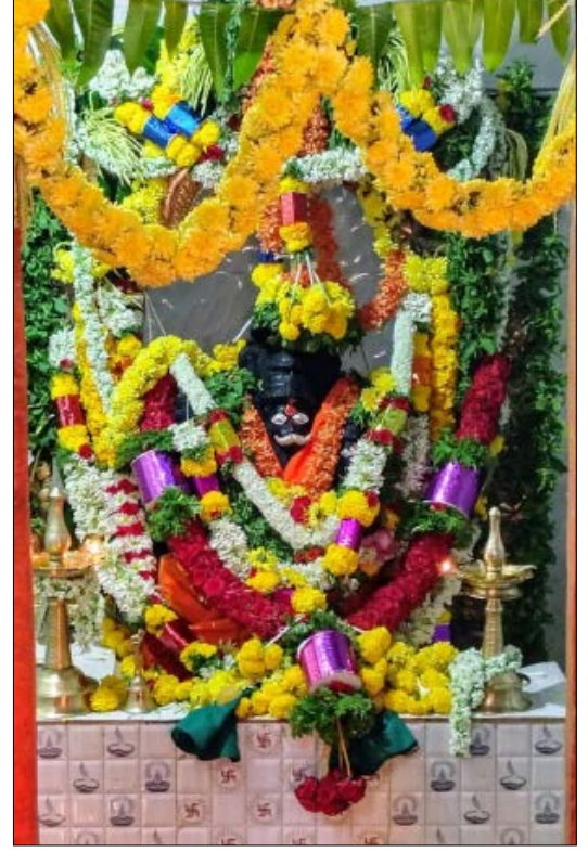
ವೈ.ಎನ್.ಹೊಸಕೋಟೆ ಗ್ರಾಮದ ಶ್ರೀ ಲಕ್ಷ್ಮಿ ನರಸಿಂಹ ಸ್ವಾಮಿ ದೇವಾಲಯ ಸಮಿತಿಯ ವತಿಯಿಂದ ನರಸಿಂಹ ಸ್ವಾಮಿ ಜಯಂತಿಯನ್ನು ವಿಜೃಂಭಣೆಯಿಂದ ಆಚರಿಸಿದರು.

ಪರಿಶೀಲಿಸಿ ನ್ಯಾಯಾಧೀಶರು ಕೆಲಸಕ್ಕೆ ತೆರಳುವ ಸಂದರ್ಭದಲ್ಲಿ ಮಕ್ಕಳ ಸುರಕ್ಷತೆಯ ಬಗ್ಗೆ ಹೆಚ್ಚಿನ ಕಾಳಜಿ ವಹಿಸಬೇಕು. ಮಕ್ಕಳನ್ನು