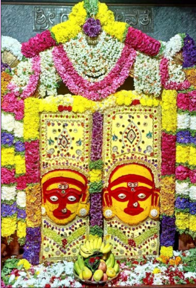
ಚಾತ್ರಾ ಸಜ್ಜಾಹದ ಪ್ರಮುಖ ಘಟ್ಟಗಳು: ಯುಗಾದಿ ಹಬ್ಬದ ನಂತರದ ಮೊದಲ ಶುಕ್ರವಾರದಂದು ಊರಮ್ಮ ಮಾರಮ್ಮ ಹಾಗೂ ಪಟಾಲಮ್ಮನ ಸಮ್ಮುಖದಲ್ಲಿ 'ಸಾಟು' ಹಾಕುವ ಮೂಲಕ ಚಾತ್ರೆಗೆ ಅಧಿಕೃತ ನಾಂದಿ ಹಾಡಲಾಗುತ್ತದೆ. ಉತ್ಸವದ ವೇಳಾಪಟ್ಟಿ ಇಂತಿದೆ: ಬುಧವಾರ: ದ್ವಜಾರೋಹಣದೊಂದಿಗೆ

ಅಲಗು ಸೇವೆ ಹಾಗೂ ರೋಮಾಂಚಕ ನಂಬಿಕೆಗಳು: ಕರಗೋತ್ಸವದ ಒಂದೆ ಅನೇಕ ರೋಚಕ ಕಥೆ ಹಾಗೂ ಅಲಿಖಿತ ತಾಸನಗಳಿವೆ. ಪ್ರತಿದಿನಯೂ ಕರ್ಕಾ ತೊಟ್ಟು ಕೈಗೊಂಡಿರಲೇ ಅವರ ಮಡದಿಯ ಮಂಗಳಸೂತ್ರವನ್ನು ತೆಗೆದಿಡುವ ಕಟ್ಟುನಿಟ್ಟಿನ ಪದ್ಧತಿ ಇಂದಿಗೂ ಚಾಲ್ತಿಯಲ್ಲಿದೆ. ಒಂದೆ ಮೆರವಣಿಗೆಯ ವೇಳೆ ಅಡತಡೆಗಳಾದಾಗ ಪ್ರತಿದಿನಯೂ ತನ್ನ ತೊಡೆಯ ರಕ್ತವನ್ನೇ ದೇವಿಗೆ ಅರ್ಪಿಸಿ ಕರಗವನ್ನು ಮುನ್ನಡೆಸಿ ದಿವ್ಯಹೃದಯವೇ ವೀರಕುಮಾರರು 'ಧಿಕ್ ಧೀ' ಎನ್ನುತ್ತಾ ಪರಿಶ್ರಮದ ಖಡ್ಗಗಳಿಂದ ಎದೆಗೆ ಬದಿಯಿಟ್ಟು 'ಅಲಗು ಸೇವೆ'ಯ ಭಕ್ತರಲ್ಲಿ ಭಕ್ತಿ ಮತ್ತು ಭಯ ಭಕ್ತಿಯನ್ನು ಏಕಕಾಲಕ್ಕೆ ಮೂಡಿಸುತ್ತದೆ.