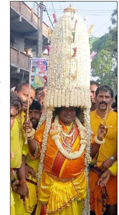
ಒನ್ನೆಲೆಯನ್ನು ಈ ಉತ್ಸವ ಸ್ಮರಿಸುತ್ತದೆ. ಕೌರವರ ಸಭೆಯಲ್ಲಿ ಅಪಮಾನಿತವಾದ ದೌಪದಿಯು ತನ್ನ ಬಿಟ್ಟಿದ ಮುಡಿಯನ್ನು ಕಟ್ಟುವುದಿಲ್ಲವೆಂದು ಮಾಡಿದ ಪ್ರತಿಜ್ಞೆ ಭೀಮನಿಂದ ದುಃಖನನನ ಎದೆಯ ರಕ್ತದ ಅಭಿಷೇಕ ಹಾಗೂ ದುರ್ಯೋಧನನ ಅಂತ್ಯದ ನಂತರ ಚೈತ್ರ ಮಣ್ಣಿನಿಂದ ನಡುರಾತ್ರಿಯಲ್ಲಿ ದೇವಿಯು ಧರಿಸಿದ ವಿಜಯೋತ್ಸವದ ರೂಪವೇ ಈ 'ಶಕ್ತುತ್ಸವ'.

ಪೌರಾಣಿಕ ಒನ್ನೆಲೆ ಧರ್ಮದ ಜಯದ ಪ್ರತೀಕ: ಭೂದೇವಿಯ ಅಧರ್ಮದ ಮೇಲೆ ಧರ್ಮದ ಜಯವನ್ನು ಕೃಷ್ಣನ ಸೋದರಿಯಾಗಿ, ಅಗ್ನಿ ಕುಂಡದಲ್ಲಿ ದೌಪದಿಯಾಗಿ ಅವತರಿಸಿದ ಪೌರಾಣಿಕ