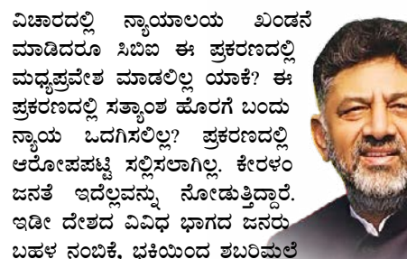
ತಿರುವನಂತಪುರ: "ಯುಡಿಎಫ್ ಮೈತ್ರಿಕೂಟದಿಂದ ಪ್ರಜ್ಞಾಚಾರ ಮುಕ್ತ ಸ್ವಚ್ಛ, ಪಾರದರ್ಶಕ ಆಡಳಿತ ನೀಡಲಾಗುವುದು. ಸರ್ಕಾರ ಹೊಣೆಗಾರಿಕೆಯಿಂದ ಕೆಲಸ ಮಾಡಲಿವು. ಕೇರಳಂ ಅಭಿವೃದ್ಧಿಗೆ ಪೂರಕವಾಗಿ ವ್ಯವಸ್ಥೆ ಬದಲಿಸಿ, ಬಂಡವಾಳ ಹೂಡಿಕೆ ತಂದು, ಉದ್ಯೋಗ ಸೃಷ್ಟಿ ಮಾಡುತ್ತೇವೆ. ಉತ್ತಮ ಕೇರಳಂ ರಾಜ್ಯಕ್ಕಾಗಿ ನಮಗೆ ಅವಕಾಶ ನೀಡಿ" ಎಂದು ಡಿಸಿಎಂ ಡಿ. ಶಿವಕುಮಾರ್ ಅವರು ಭರವಸೆ ನೀಡಿದರು.

"ಕೇರಳಂ ಪ್ರಜ್ಞಾಚಾರ, ವಿದ್ಯಾವಂತರು, ನಂಬಿಕಸ್ತರು, ಪ್ರಮಜೀವಿಗಳು. ಅವರು ಹೊರ ರಾಜ್ಯಗಳಲ್ಲಿ ದುಡಿದರೂ ತಮ್ಮ ಊರಿಗೆ ಬಂದು ಹಣ ಹೂಡಿಕೆ ಮಾಡುತ್ತಾರೆ. ಇನ್ನಾದರೂ ಇಲ್ಲಿನ ಸರ್ಕಾರ ಈ ವಿಚಾರವಾಗಿ ನೀತಿ ರೂಪಿಸಲು ವಿಫಲವಾಗಿದೆ. ಈ ಭಾಗದ ಅಭಿವೃದ್ಧಿ ಮಾಡಿ, ಬಂಡವಾಳ ತಂದು, ಉದ್ಯೋಗ ಸೃಷ್ಟಿಸಿ ರಾಜ್ಯದ ಜಿಡಿಪಿ ಬೆಳೆಯುವಂತೆ ಮಾಡದಿದ್ದ ಮೇಲೆ ನೀವು ಯಾವ ಕಾರಣಕ್ಕೆ ಅಧಿಕಾರದಲ್ಲಿರಬೇಕು? ಎಲ್ ಡಿಎಫ್ ಸರ್ಕಾರವನ್ನು ಕೇಂದ್ರ ಸರ್ಕಾರ ದಾಳಿ ಮಾಡುತ್ತಿಲ್ಲ, ನೀವು ಕೇಂದ್ರ ಬಿಜೆಪಿ ಸರ್ಕಾರದ ಜೊತೆ ಉತ್ತಮ ಬಾಂಧವ್ಯ ಹೊಂದಿದ್ದೀರಿ. ಆದರೆ ಕರ್ನಾಟಕ, ತೆಲಂಗಾಣ, ತಮಿಳುನಾಡು ಹಾಗೂ ಇತರ ರಾಜ್ಯಗಳಲ್ಲಿ ವಿರೋಧ ಪಕ್ಷಗಳ ಆಡಳಿತದಲ್ಲಿ ಒಂದು ಸಣ್ಣ ಪ್ರಕರಣ, ಆರೋಪ ಬಂದರೂ ಕೂಡಲೇ ಎಫ್‌ಐಆರ್ ದಾಖಲಿಸಿ ತನಿಖಾ ಸಂಸ್ಥೆಗಳ ಮೂಲಕ ದಾಳಿ ಮಾಡಲಾಗುತ್ತದೆ. ಇಡಿ, ಸಿಬಿಐ, ಐಟಿ ಮಧ್ಯಪ್ರದೇಶಿಸುತ್ತದೆ. ಆದರೆ ಇಲ್ಲಿ ಅನೇಕ ಪ್ರಜ್ಞಾಚಾರ ಪ್ರಕರಣ ನಡೆದಿದ್ದರೂ ಯಾವುದೇ ತನಿಖೆ, ಹಸ್ತಕ್ಷೇಪವಿಲ್ಲ" ಎಂದು ಪರಿಹಾಯ್ದರು.