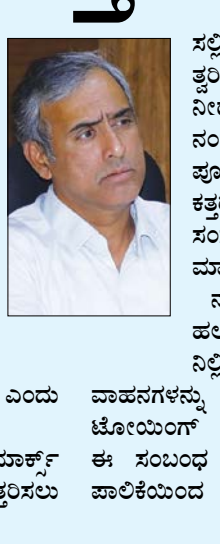
ಡಾಂಬರೀಕರಣ ಕಾರ್ಯ ನಡೆಸಬೇಕೆಂದು ಸೂಚಿಸಿದರು.

ಡಾಂಬರೀಕರಣ ಕಾರ್ಯ ನಡೆಸಬೇಕೆಂದು ಸೂಚಿಸಿದರು. ನಗರದಲ್ಲಿ ವಿವಿಧ ಕಾಮಗಾರಿಗಳಿಗಾಗಿ ರಸ್ತೆ ಕತ್ತರಿಸಲು ಮಾರ್ಕ್ಸ್ ಸಾಫ್ಟ್‌ವೇರ್ ತಂತ್ರಾಂಶದ ಮೂಲಕ ಅನುಮತಿ ಪಡೆದು, ಕಾಮಗಾರಿ ಪೂರ್ಣಗೊಂಡ ಬಳಿಕ ರಸ್ತೆ ದುರಸ್ತಿ ಮಾಡದಿದ್ದಲ್ಲಿ ಪಾಲಿಕೆಯಿಂದಲೇ ದುರಸ್ತಿ ಕಾರ್ಯ ಕೈಗೊಂಡು, ಅದರ ವೆಚ್ಚವನ್ನು ಸಂಬಂಧಪಟ್ಟ ಸಂಸ್ಥೆಗಳಿಂದ ವಸೂಲಿ ಮಾಡಲು ಕ್ರಮಹೀನಿಬೇಕು ಎಂದು ಸೂಚಿಸಿದರು. ಗೇಲ್ ಗ್ಯಾಸ್ ಸಂಸ್ಥೆ ಪತಿಯಿಂದ ಮಾರ್ಕ್ಸ್ ಸಾಫ್ಟ್‌ವೇರ್ ಮೂಲಕ ರಸ್ತೆ ಕತ್ತರಿಸಲು