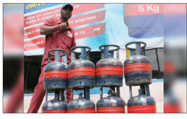
ಲಭ್ಯವಿದೆ. ಸೂಕ್ತ ಗುರುತಿನ ಚೀಟಿ ತೋರಿಸಿ ಗ್ಯಾಸ್‌ಹುಡು ಸಿಲಿಂಡರ್ ಪಡೆಯಬಹುದು ಎಂದು ಕೇಂದ್ರ ಸರ್ಕಾರ ಹೇಳಿದೆ. ಎಲ್‌ಪಿಜಿ ಬಿಕ್ಕಟ್ಟು ಪೂರೈಸಲು 5 ಕೆಜಿ ಸಿಲಿಂಡರ್ ಪೂರೈಕೆ ಹೆಚ್ಚಿಸಿದ ಬೆನ್ನಲೇ ಇವುಗಳ ಖರೀದಿಗೂ ಜನ ಆಸಕ್ತಿ ತೋರಿದ್ದಾರೆ.

ನವದೆಹಲಿ: ಅಮೆರಿಕ ಮತ್ತು ಇರಾನ್ ನಡುವಿನ ಯುದ್ಧ 38ನೇ ದಿನಕ್ಕೆ ಕಾಲಿಟ್ಟಿದೆ. ಇದರಿಂದ ಎಲ್‌ಪಿಜಿ ಕೊರತೆ ಅತಂಕದಲ್ಲಿದ್ದ ಜನಕ್ಕೆ ಕೇಂದ್ರ ಸರ್ಕಾರ ಮತ್ತು ಅಭಿವೃದ್ಧಿ ದೇಶದಲ್ಲಿ ಎಲ್‌ಪಿಜಿ ಕೊರತೆ ಇಲ್ಲ ಎಂದಿರುವ ಕೇಂದ್ರ ಸರ್ಕಾರ ಮತ್ತು ಅಭಿವೃದ್ಧಿ ಕಡೆ ಕೊರತೆ ನೀಗಿಸಲು 5 ಕೆಜಿ ಗ್ಯಾಸ್ ಸಿಲಿಂಡರ್‌ಗಳ ಪೂರೈಕೆಯನ್ನು ಹೆಚ್ಚಿಸಿದೆ. ಭಾರತದಲ್ಲಿ ಎಲ್‌ಪಿಜಿ ಕೊರತೆಯಿಲ್ಲ, ಸಾಕಷ್ಟು ಲಭ್ಯವಿದೆ. ಜನರು ಅತಂಕಕ್ಕೆ ಒಳಗಾಗುವ ಅಗತ್ಯವಿಲ್ಲ. 5 ಕೆಜಿ ತೂಕದ ಎಲ್‌ಪಿಜಿ ಸಿಲಿಂಡರ್‌ಗಳು ಎಲ್ಲ ಬಜೆಟ್‌ಗಳಲ್ಲೂ ಲಭ್ಯವಿದೆ. ಸೂಕ್ತ ಗುರುತಿನ ಚೀಟಿ ತೋರಿಸಿ ಗ್ಯಾಸ್‌ಹುಡು ಸಿಲಿಂಡರ್ ಪಡೆಯಬಹುದು ಎಂದು ಕೇಂದ್ರ ಸರ್ಕಾರ ಹೇಳಿದೆ. ಎಲ್‌ಪಿಜಿ ಬಿಕ್ಕಟ್ಟು ಪೂರೈಸಲು 5 ಕೆಜಿ ಸಿಲಿಂಡರ್ ಪೂರೈಕೆ ಹೆಚ್ಚಿಸಿದ ಬೆನ್ನಲೇ ಇವುಗಳ ಖರೀದಿಗೂ ಜನ ಆಸಕ್ತಿ ತೋರಿದ್ದಾರೆ.