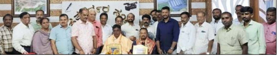
ಪ್ರತಿಭಲ ಸಿಕ್ಕಿತೆ ಪತ್ರಿಕೋದ್ಯಮದಲ್ಲಿ ಸಾಧನೆ ಮಾಡಿದವರಿಗೆ ಸ್ವಲ್ಪ ತಡವಾಗಿಯಾದರೂ ಪ್ರಶಸ್ತಿ ಸಿಗುವುದು ಏಕೆಂದರೆ ಎಂಬ ವಿಶ್ವಾಸ ವ್ಯಕ್ತಪಡಿಸಿದರು. ನಮ್ಮ ಬರವಣಿಗೆ ಮೂಲಕ ಜನರು ನಮ್ಮನ್ನು ಗುರುತಿಸುತ್ತಾರೆ ಹೊರತು ಪತ್ರಕರ್ತರ ಸಂಘದಲ್ಲಿ ನಾನು ಪದಾಧಿಕಾರಿಯಾದರೆ ನಮ್ಮನ್ನ ಜನರು ಗುರುತಿಸುತ್ತಾರೆ ಎಂಬ ಭ್ರಮೆಯಲ್ಲಿ ಕೆಲವು ಪತ್ರಕರ್ತರು ಇದ್ದಾರೆ. ಪ್ರಶಸ್ತಿಗಳು ಸುಮ್ಮನೆ ಬರೋದಿಲ್ಲ ನಮ್ಮ ಬರವಣಿಗೆ ನಮ್ಮಗೆ ಎಲ್ಲಾ ರೀತಿಯ ಅವಕಾಶಗಳನ್ನು ಒದಗಿಸುತ್ತದೆ. ಪತ್ರಕರ್ತರಿಗೆ ಪ್ರಶಸ್ತಿಗಳು ಬಂದಾಗ ಅವರನ್ನು ಪ್ರೋತ್ಸಾಹಿಸುವ ಕೆಲಸ ಮಾಡಬೇಕು. ಅದು ಬಿಟ್ಟು ಅಸೂಹೆ ಪಡಬಾರದು. ಪತ್ರಕರ್ತರ ಸಂಘದಿಂದ ಪ್ರಶಸ್ತಿ ಪುರಸ್ಕೃತರನ್ನು ಪ್ರೋತ್ಸಾಹಿಸುವ ಕೆಲಸ ಮಾಡಿಕೊಂಡು ಬರುತ್ತಿದ್ದೇವೆ ಎಂದು ಹೇಳಿದರು.