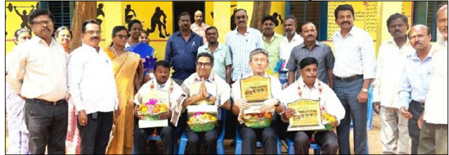
ಶಾಲೆಗಳನ್ನು ನವೀಕರಿಸುತ್ತಿರುವ ಶಾಸ್ತ್ರೀಯ. ಬಡ ಮತ್ತು ಸಾಮಾನ್ಯ ವರ್ಗದ ಮಕ್ಕಳು ಹೆಚ್ಚಾಗಿ ಸರ್ಕಾರಿ ಶಾಲೆಗಳನ್ನು ಅವಲಂಬಿಸಿದ್ದು, ಖಾಸಗಿ ಶಾಲೆಗಳಿಗೆ ಪ್ರೈವೇಟ್ ನೀಡುವಂತಹ ಉತ್ತಮ ಪರಿಸರ ಮತ್ತು ಗುಣಾತ್ಮಕ ಶಿಕ್ಷಣ ಇಲ್ಲಿ ದೊರೆಯಬೇಕು ಎಂದು ಅಭಿಪ್ರಾಯಿಸಿದರು.