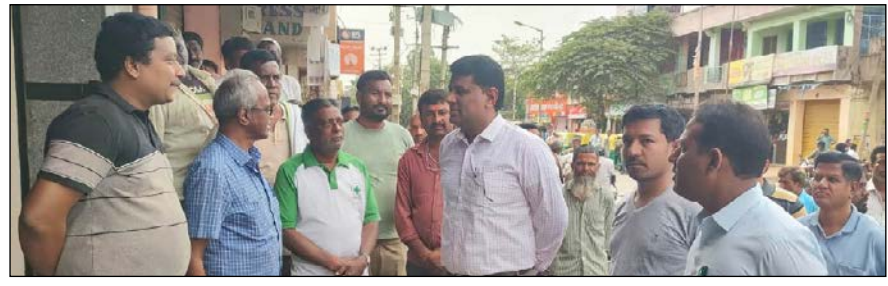
ಜಾಗದ ತಮ್ಮ ಕಟ್ಟಡಗಳನ್ನು ಸ್ವಯಂ ಪ್ರೇರಿತರಾಗಿ ತೆರವುಗೊಳಿಸುವುದಾಗಿ ಭರವಸೆ ನೀಡಿದ್ದಾರೆ. ನಗರದ ಅಭಿವೃದ್ಧಿ ದೃಷ್ಟಿಯಿಂದ ಹಾಗೂ ಸುಗಮ ಸಂಚಾರದ ಹಿತದೃಷ್ಟಿಯಿಂದ ಈ ರಸ್ತೆಗಳ ಅಭಿವೃದ್ಧಿ ಕಾರ್ಯ ಅನಿವಾರ್ಯವಾಗಿದೆ. ಈ ನಿಟ್ಟಿನಲ್ಲಿ ಈ ರಸ್ತೆಯ ಇಕ್ಕಲಗಳಲ್ಲಿನ ಎಲ್ಲ ಅಂಚಿ ಮಳಿಗೆಗಳ ಮಾಲೀಕರು, ವ್ಯಾಪಾರಿಗಳು, ನಿವಾಸಿಗಳು ಸಹಕಾರ ನೀಡುವಂತೆ ಕೋರಿದರು.