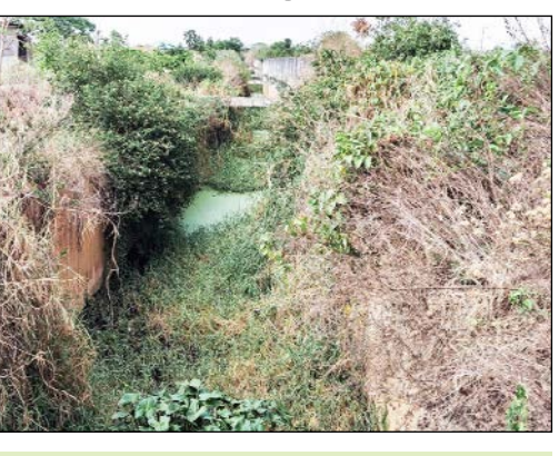
ಬೆಂಗಳೂರಿನ ಕೆಲವು ಪರಿಹಾರವಾಗಿ ಕೋರ್ಡ್ ಮೆಟ್ರೋಲಿಡ ಕಾರಣ ಭೈರಮಂಗಲ ಕೆರೆ ಶುದ್ಧೀಕರಣ, ಸಂಸ್ಕರಣಾ ಘಟಕ ಹಾಗೂ ಡೈವರ್ಸ್ ಜಾನ್ಲ್ ಯೋಜನೆ ಕಾಮಗಾರಿ ಏರ್ಪಡಿಸಲಾಗಿದೆ. ನ್ಯಾಯಾಲಯಕ್ಕೆ ಅಗತ್ಯ ದಾಖಲೆಗಳನ್ನು ಒದಗಿಸಿದ್ದು ಇನ್ನೆರಡು ತಿಂಗಳಲ್ಲಿ ತೀರ್ಮಾನ ಹೊರಬರುವ ವಿಶ್ವಾಸವಿದೆ. ಬಳಿಕ ಶೇ.50ರಷ್ಟು ಖಾತಿಯಿರುವ ತಿರುವನಂತರ ಪೂರ್ವದ ಕೋಟೆ ಯೋಜನೆಗೆ ಮರುಜೀವ ನೀಡಲಾಗುವುದು.

ರಾಮನಗರ ಕಲುಷಿತ ನೀರಿನಿಂದ ಕೂಡಿರುವ ತಾಲ್ಲೂಕಿನ ಭೈರಮಂಗಲ ಕೆರೆ ಯ ಸುತ್ತಮುತ್ತಲ ಗ್ರಾಮಗಳಲ್ಲಿ ಸೊಟ್ಟಿ ಹಾವಳಿ ಹೆಚ್ಚಾಗಿದ್ದು ಜನಜೀವನ ಅಸ್ತವ್ಯಸ್ತವಾಗಿದೆ. ಸಂಚಿಯಾಗುತ್ತಿದ್ದಂತೆ ಗುಂಯ್ ಗುಡುತ್ತಾ ದಾಳಿಯಿಡುವ ಸೊಟ್ಟಿಗಳ ಕಾಟಕ್ಕೆ ಜನರು ನಲುಗುವಂತಾಗಿದೆ. ವ್ಯವಸ್ಥಾಪಕ ನದಿಯ ಮೂಲಕ ವರ್ಷಪೂರ್ತಿ ಹರಿಯುವ ಕೊಳೆತ ನೀರು ಭೈರಮಂಗಲ ಜಲಾಶಯದಲ್ಲಿ ಸಂಗ್ರಹವಾಗಿ ನಂತರ ಎಡದಂಡೆ ಮತ್ತು ಬಲದಂಡೆ ನಾಲೆಗಳು ಹಾಗೂ ವ್ಯವಸ್ಥಾಪಕ ಕೆರೆಗಳಲ್ಲಿ ಹರಿಯುತ್ತವೆ. ಇದರ ಪರಿಣಾಮ ಸೊಟ್ಟಿಗಳ ಉತ್ಪತ್ತಿ ಮಿತಿಯಿದ್ದು ಈ ಸಮಸ್ಯೆ ಇದೀಗ ಜನಜನಾಪಾದಗಳ ಆರೋಗ್ಯಕ್ಕೆ ದೊಡ್ಡ ಸವಾಲಾಗಿ ಪರಿಣಮಿಸಿದೆ. ಭೈರಮಂಗಲ ಕೆರೆಯ ಸಮೀಪದಲ್ಲಿರುವ ಗ್ರಾಮಗಳು ಸೊಟ್ಟಿಗಳಿಂದ ತುಂಬಿಹೋಗಿದ್ದು ನಿಯಂತ್ರಣ ಸಾಧ್ಯವಿಲ್ಲವೇ? ಎನ್ನುವ ಪ್ರಶ್ನೆ ಕಾಡುತ್ತಿದೆ.