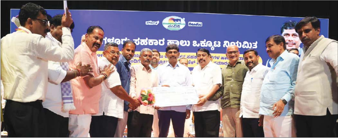
ಬೆಂಗಳೂರಿನ ಡಾ.ಬಾಬು ಜಗಜೀವನ್ ರಾಮ್ ಭವನದಲ್ಲಿ ಬುದ್ಧವಾರ ನಡೆದ ಬಿಮೋಲ್ ಚಕ್ರಾಭಿಷೇಕ ವ್ಯಾಪ್ತಿಯ ಎಲ್ಲಾ ಕಾಲು ಉತ್ಪಾದಕರ ಸಹಕಾರ ಸಂಘಟನೆ ಸ್ಥಾಪನೆಗೆ ವಿಶೇಷ ಪೂಜಾರ್ಪಣೆ ಧನದ ಚಿಕ್ ವಿತರಣಾ ಸಮಾರಂಭದಲ್ಲಿ ಚಕ್ರಾಭಿಷೇಕ ನಿದೇಶಿತರೂ ಹಾಗೂ ಅಧಿಕಾರಿಗಳೊಂದಿಗೆ ಬಿಮೋಲ್ ಅಧ್ಯಕ್ಷ ಡಿ.ಕೆ.ಸುರೇಶ್ ಅವರು ಪಾಲ್ಗೊಂಡರು.