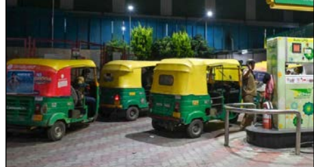
ಸಂಸ್ಥೆಗಳಲ್ಲಿ ಮಾತ್ರ ಅಲ್ಪಮಟ್ಟಿನ ಕೊರತೆ ಕಂಡುಬಂದಿದ್ದು, ಇದನ್ನು ಸರಿಪಡಿಸಲು ಸರ್ಕಾರ ಸ್ವಾಮ್ಯದ ತೈಲ ಕಂಪನಿಗಳಾದ ಬಪಿಲಿ (ಇಂಡಿಯನ್ ಆಯಿಲ್), BPC (ಭಾರತ್ ಪೆಟ್ರೋಲಿಯಂ) ಮತ್ತು HPC

ಕಾಸನ ರಾಜ್ಯದ ವಿವಿಧ ಆಟೋ ಗ್ಯಾಸ್ ಬಂಕ್‌ಗಳಲ್ಲಿ ಅನಿಲದ ದಾಸ್ತಾನು ಕೊರತೆಯಿದೆ ಎಂಬ ತಪ್ಪು ಮಾಹಿತಿಯ ಆಧಾರದ ಮೇಲೆ, ಕಳೆದ ಕೆಲವು ದಿನಗಳಿಂದ ಆಟೋ ಮಾಲೀಕರು ಮತ್ತು ಚಾಲಕರು ಬಂಕ್‌ಗಳ ಮುಂದೆ ಸುದೀರ್ಘ ಸರತಿ ಸಾಲಿನಲ್ಲಿ ನಿಲ್ಲುತ್ತಿರುವ ಅಶರ ಸರ್ಕಾರದ ಗಮನಕ್ಕೆ ಬಂದಿದೆ. ಈ ಕುರಿತು ಕೆಲವು ಮಾಧ್ಯಮಗಳಲ್ಲಿ ಪ್ರಕಟವಾಗಿರುವ ವರದಿಗಳು ಕೇವಲ ವದಂತಿಗಳಾಗಿದ್ದು, ಸಾರ್ವಜನಿಕ ಅತಂಕಪಡುವ ಆಗತ್ಯವಿಲ್ಲ ಎಂದು ಆಹಾರ, ನಾಗರಿಕ ಸರಬರಾಜು ಮತ್ತು ಗ್ರಾಹಕರ ವ್ಯವಹಾರಗಳ ಇಲಾಖೆಯು ಸ್ಪಷ್ಟಪಡಿಸಿದೆ. ಕೆಲವು ಖಾಸಗಿ ಆಟೋ ಗ್ಯಾಸ್ ಸರಬರಾಜು