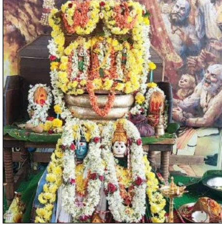
ಬಳ್ಳಾರಿ ನಗರದ ಜನನಿಜಡ ಪ್ರದೇಶವಾದ ಕಾಳಮ್ಮ ಜೀಡಿಯ ಶ್ರೀ ಕಾಳಿಕಾ ಕಮಲೇಶ್ವರ ಸ್ವಾಮಿ ದೇವಸ್ಥಾನದಲ್ಲಿ ಶ್ರೀ ಕಾಳಿಕಾ ಕಮಲೇಶ್ವರ ಸ್ವಾಮಿಯ ಕಲ್ಯಾಣೋತ್ಸವ ಕಾರ್ಯಕ್ರಮ ಅದ್ವೈತಿಯಾಗಿ ನಡೆಯಿತು. ಶಿಖರಕರ್ಮ ಸಮುದಾಯದ ವತಿಯಿಂದ ಆಯೋಜಿಸಿದ ಕಾರ್ಯಕ್ರಮದಲ್ಲಿ ಸಕಲ ಸದ್ಭಕ್ತರು ಇದ್ದರು.