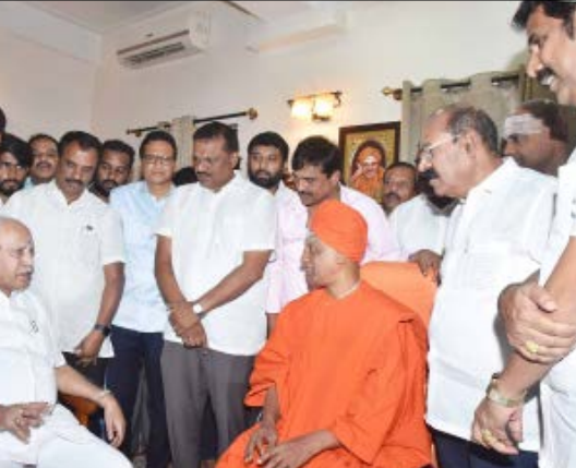
ಕೆಲಸ ಆರಂಭಿಸಲು: ಸುದ್ದಿಗಾರರೊಂದಿಗೆ ಮಾತನಾಡಿದ ಶ್ರೀಗಳ 119ನೇ ಜಯಂತಿಯ ಶುಭ ಸಂದರ್ಭದಲ್ಲಿ ಗದ್ದುಗೆ ದರ್ಶನ ಪಡೆಯುವ ಸೌಭಾಗ್ಯ ನನ್ನದಾಗಿದೆ.