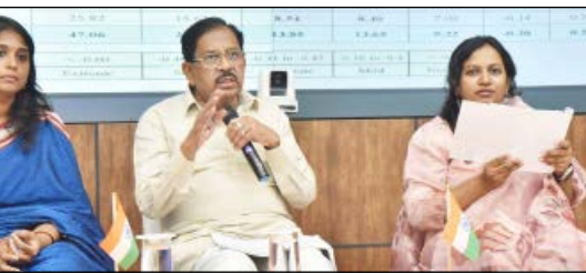
ಹಂತವಾಗಿ ಟ್ಯಾಂಕರ್ ಮೂಲಕ, ಎರಡನೇ ಹಂತದಲ್ಲಿ ಖಾಸಗಿ ಬೋರ್‌ವೆಲ್‌ಗಳ ಬಾಡಿಗೆ ಮೂಲಕ ಹಾಗೂ ಮೂರನೇ ಹಂತದಲ್ಲಿ ಸಮೀಪದ ಮೂಲಗಳಿಂದ ನೀರು ಸರಬರಾಜು ಮಾಡಲು ಕ್ರಮ ಕೈಗೊಳ್ಳಲಾಗಿದೆ. ಈ ಮೂರೂ ಸಾಧ್ಯವಾಗದಿದ್ದಲ್ಲಿ ಹೊಸದಾಗಿ ಬೋರ್‌ವೆಲ್ ಕೊರೆಸಲು ಜಿಲ್ಲಾಧಿಕಾರಿಗಳು ಅಥವಾ ಜಿಪಂ ಸಿಇಬಿ ಅವರು ತಕ್ಷಣ ಅನುಮತಿ ನೀಡಬೇಕು. ಬೆಸ್ಕಾಂ ಅಧಿಕಾರಿಗಳು ವಿಳಂಬ ಮಾಡದೆ ವಿದ್ಯುತ್ ಸಂಪರ್ಕ ಅಂತರ್ಜಲ ಕುಸಿತದ ಬಗ್ಗೆ ಭೂವಿಜ್ಞಾನ ವರದಿ: "ಭಾರತೀಯ ಭೂವಿಜ್ಞಾನ ಸಮೀಕೃತ ವರದಿ ಪ್ರಕಾರ, ತುಮಕೂರು ಜಿಲ್ಲೆಯ ಭೂಭಾಗದ ತಳದಲ್ಲಿ ಗ್ರಾಫೈಟ್ ಪದರ ಇರುವುದರಿಂದ ಅಂತರ್ಜಲ ಮಟ್ಟ ಇಳಿದಾಗ ಕುಸಿಯುತ್ತಿದೆ. ಕೋಲಾರ ಮತ್ತು ತುಮಕೂರು ಜಿಲ್ಲೆಗಳಲ್ಲಿ ನೀರಿನ ಅತಿಹೆಚ್ಚು ತೋಷಣೆಯಾಗುತ್ತಿದೆ. ಈ ಹಿನ್ನೆಲೆಯಲ್ಲಿ ಅಂತರ್ಜಲ ವೃದ್ಧಿಗೆ ಶಾಶ್ವತ

ತುಮಕೂರು ಮಾರ್ಚ್ 15ರ ನಂತರ ಜಿಲ್ಲೆಯಲ್ಲಿ ತೀವ್ರ ಬೇಸಿಗೆ ಆರಂಭವಾಗಿದ್ದು, ಕುಡಿಯುವ ನೀರಿನ ಸಮಸ್ಯೆ ಎದುರಿಸುತ್ತಿರುವ 100 ಹಳ್ಳಿಗಳಿಗೆ ತಕ್ಷಣವೇ ಪರ್ಯಾಯ ವ್ಯವಸ್ಥೆ ಕಲ್ಪಿಸುವಂತೆ ಗೃಹ ಸಚಿವರು ಹಾಗೂ ಜಿಲ್ಲಾ ಉಸ್ತುವಾರಿ ಸಚಿವ ಡಾ. ಜಿ. ಪರಮೇಶ್ವರ್ ಅಧಿಕಾರಿಗಳಿಗೆ ಕಟ್ಟುನಿಟ್ಟಿನ ಸೂಚನೆ ನೀಡಿದ್ದಾರೆ. ನಗರದ ಸಾರ್ವಜನಿಕ ಸಭಾಂಗಣದಲ್ಲಿ ನಡೆದ ಜಿಲ್ಲಾ ಮಟ್ಟದ ಪ್ರಗತಿ ಪರಿಶೀಲನಾ ಸಭೆಯ ಬಳಿಕ ಸುದ್ದಿಗಾರರೊಂದಿಗೆ ಮಾತನಾಡಿದ ಅವರು, ಪಾವಗಡ ಹೊರತುಪಡಿಸಿ ಜಿಲ್ಲೆಯ ಉಳಿದಲ್ಲೂ ತಾಲೂಕುಗಳಿಗೆ ಆಯ್ದು ಗ್ರಾಮಗಳಲ್ಲಿ ನೀರಿನ ಸಮಸ್ಯೆ ಗುರುತಿಸಲಾಗಿದೆ ಎಂದು ತಿಳಿಸಿದರು. ನೀರಿನ ಸಮಸ್ಯೆ ನಿರೀಕ್ಷಿಸಲು ತತ್ಪಾರವಿರುವ ಗ್ರಾಮಗಳಲ್ಲಿ ಮೊದಲ