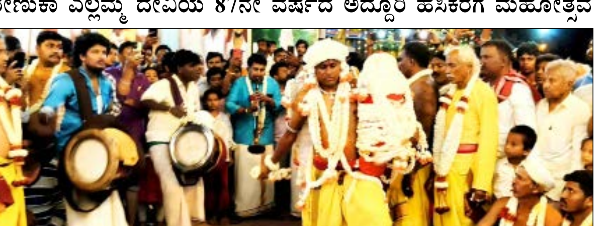
ಮುಂಭಾಗದಲ್ಲಿನ ಕಣದಲ್ಲಿ ಬಳಿ ತೊಡಿಸುವ ಮತ್ತು ಪೋತುಲು ರಾಜನನ್ನು ರೇಗಿಸುವಂತಹ ಕಾರ್ಯಕ್ರಮ ನಡೆಯಿತು. ಹುಬ್ಬಳ್ಳಿವನ್ನು ಕಂಕಳಲ್ಲಿ ಹೊತ್ತು, ಕರಗದ ಪೂಜಾರಿ ಸಾಗುತ್ತಿದ್ದರೆ, ಕರಗಕ್ಕೆ ಮಲ್ಲಿಗೆ ಹೂವು ಎಸೆಯುತ್ತ ಗೋವಿಂದನು, ನಾಮಸ್ಮರಣೆ ಮಾಡುತ್ತಾ, ಸಾಗಿದ ವೀರಕುಮಾರರ ಕರಗವನ್ನು ಹಿಂಬಾಲಿಸಿದರು. ಪಟ್ಟಣದ ಬೀದಿಗಳಲ್ಲಿ ಭಕ್ತರು ಪೂಜೆ ಸಲ್ಲಿಸಿದರು. ವೀರಕುಮಾರರು ಅಲಗು ಸೇವೆ ಮಾಡಿದರು. ಹುಬ್ಬಳ್ಳಿವನ್ನು ಪಟ್ಟಣದ ಪ್ರತಿಯೊಂದು ದೇವಾಲಯಗಳಲ್ಲಿ ವಿಶೇಷ ಪೂಜೆ ಸಲ್ಲಿಸಿದರು. ಮನೆ ಮನೆಗಳಲ್ಲಿ ಮತ್ತು ಇಡೀ ಪಟ್ಟಣದಲ್ಲಿ ಮತ್ತಮತ್ತಲೇನು ಗ್ರಾಮಗಳಿಂದ ಸಾವಿರಾರು ಮಂದಿ ಕರಗ ವೀಕ್ಷಣೆಗೆ ಬಂದಿದ್ದರು.