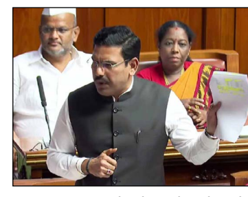
ರಾಜ್ಯದ ಜನರ ಮೇಲೆ ಪದೇಪದೇ ಬೆಲೆ ಏರಿಕೆಯ ಬ್ರಹ್ಮಾಸ್ತ್ರವನ್ನು ರಾಜ್ಯ ಸರ್ಕಾರ ಪ್ರಯೋಗ ಮಾಡುತ್ತಿರುವುದು ಈ ನಾಡಿನ ದುರಂತ ಎಂದು ಬಿ.ವೈ.ವಿಜಯೇಂದ್ರ ಹೇಳಿದರು.

ಬೆಂಗಳೂರು ಮುಖ್ಯಮಂತ್ರಿಗಳು ಮಂಡಿಸಿದ 2026-27ನೇ ಸಾಲಿನ ರಾಜ್ಯ ಬಜೆಟ್‌ನಲ್ಲಿ ಜನರ ನಿರೀಕ್ಷೆಗಳನ್ನು ಹುಸಿಗೊಳಿಸಿದ್ದಾರೆ ಎಂದು ಬಿಜೆಪಿ ರಾಜ್ಯಾಧ್ಯಕ್ಷ ಮತ್ತು ಶಾಸಕ ಬಿ.ವೈ.ವಿಜಯೇಂದ್ರ ತಿಳಿಸಿದ್ದಾರೆ. ವಿಧಾನಸಭೆಯಲ್ಲಿ ಗುರುವಾರ ಸಂಭವ ಮಾತನಾಡಿದ ಅವರು, ಈ ಬಜೆಟ್ ಗಮನಿಸಿದರೆ ಈ ಸರ್ಕಾರದ ಆರ್ಥಿಕ-ಬೌದ್ಧಿಕ ದಿವಾಳಿತನವು ಕೂಡ ಪ್ರದರ್ಶನಗೊಂಡಿದೆ. ಹಣಕಾಸಿನ ಸಚಿವರಾದ ಮುಖ್ಯಮಂತ್ರಿಗಳು ತನ್ನ ರಾಜಕೀಯ ಸಂಧ್ಯಾಕಾಲದಲ್ಲಿರುವ ಈ ಸಂದರ್ಭದಲ್ಲಿ 17ನೇ ಬಜೆಟ್ ಮಂಡಿಸಿದ್ದಾರೆ. ಅವರಿಗೆ ಒಂದು ಸುವರ್ಣಾಕಾಶ ಇತ್ತು. ತಮ್ಮ ರಾಜಕೀಯ ಜೀವನದ ಸುದೀರ್ಘ ಅನುಭವದ ಆಧಾರದ ಮೇಲೆ ರಾಜ್ಯದ ಸಂಪನ್ಮೂಲಗಳ ನಾಡಿನ ಜನರ ಅಪೇಕ್ಷೆಗೆ ತಕ್ಕಂತೆ ಉತ್ತರ ಕಂಡುಕೊಳ್ಳುವ ಅವಕಾಶ ಇತ್ತು. ಆದರೆ, ಈ ಬಜೆಟ್ ನೋಡಿದಾಗ ಅಸಹಾಯಕರಾಗಿ ಕೈಚೆಲ್ಲಿದ್ದಾರೆಯೇ ಭಾವನೆ ರಾಜ್ಯದ ಜನರಲ್ಲಿ ಮೂಡಿದೆ ಎಂದು ವಿಚಾರಿಸಿದರು.