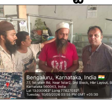
ಮತ್ತು ವೈಜ್ಞಾನಿಕವಲ್ಲದ ರೀತಿಯಲ್ಲಿ ಮಾಂಸ ಸಂಗ್ರಹಿಸಿರುವುದು ಕಂಡುಬಂದಿದೆ ದಂಡ ಮತ್ತು ಕಟ್ಟುನಿಟ್ಟಿನ ಸೂಚನೆ: