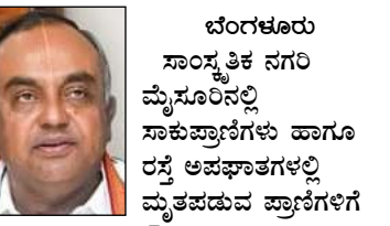
ಬೆಂಗಳೂರು ಸಾಂಸ್ಕೃತಿಕ ನಗರ ಮೈಸೂರಿನಲ್ಲಿ ಸಾಕಾಪ್ರಾಣಿಗಳು ಹಾಗೂ ರಸ್ತೆ ಅಪಘಾತಗಳಲ್ಲಿ ಮೃತಪಡುವ ಪ್ರಾಣಿಗಳಿಗೆ ಗೌರವಯುತವಾಗಿ