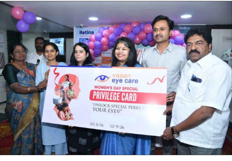
ವಾಸನ್ ಐ ಕೇರ್ ಆಸ್ಪತ್ರೆ, ಜಯನಗರದಲ್ಲಿ ಮಹಿಳಾ ದಿನಾಚರಣೆ