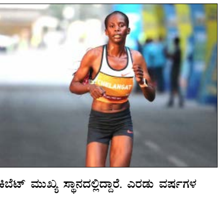
ಕೆಬೆಟ್ ಮುಖ್ಯ ಸ್ಥಾನದಲ್ಲಿದ್ದಾರೆ. ಎರಡು ವರ್ಷಗಳ

ಬೆಂಗಳೂರು ಏಪ್ರಿಲ್ 26ರ ಭಾನುವಾರ ನಡೆಯಲಿರುವ ಟಿವಿಎಸ್ ವರ್ಲ್ಡ್ 10 ಕೆ ಬೆಂಗಳೂರಿನ 18ನೇ ಆವೃತ್ತಿಗಾಗಿ ವಿಶ್ವದ ಕೆಲವು ಅತ್ಯುತ್ತಮ ಓಟಗಾರರು ಬೆಂಗಳೂರಿಗೆ ಆಗಮಿಸಿದ್ದಾರೆ. ವಿಶ್ವ ಅಥ್ಲೆಟಿಕ್ಸ್ ಗೋಲ್ಡ್ ಲೀವರ್ ರೇಸ್ ಒಟ್ಟು 210,000 ಯುಎಸ್ ಡಾಲರ್ ಬಹುಮಾನವನ್ನು ಹೊಂದಿದೆ. ಪುರುಷರ ಮತ್ತು ಮಹಿಳೆಯರ ವಿಭಾಗಗಳಲ್ಲಿ ವಿಜೇತರಿಗೆ 26,000 ಯುಎಸ್ ಡಾಲರ್ ಮತ್ತು ಕೋರ್ಸ್(ಕೂಟ) ದಾಖಲೆಯ ಪ್ರದರ್ಶನಗಳಿಗೆ ಗಮನಾರ್ಹ ಬೋನಸ್ ಬಹುಮಾನ ಇದೆ. ಪುರುಷರ ವಿಭಾಗದಲ್ಲಿ ಉಗಾಂಡಾದ ಹಾರ್ಟ್‌ಜೆ