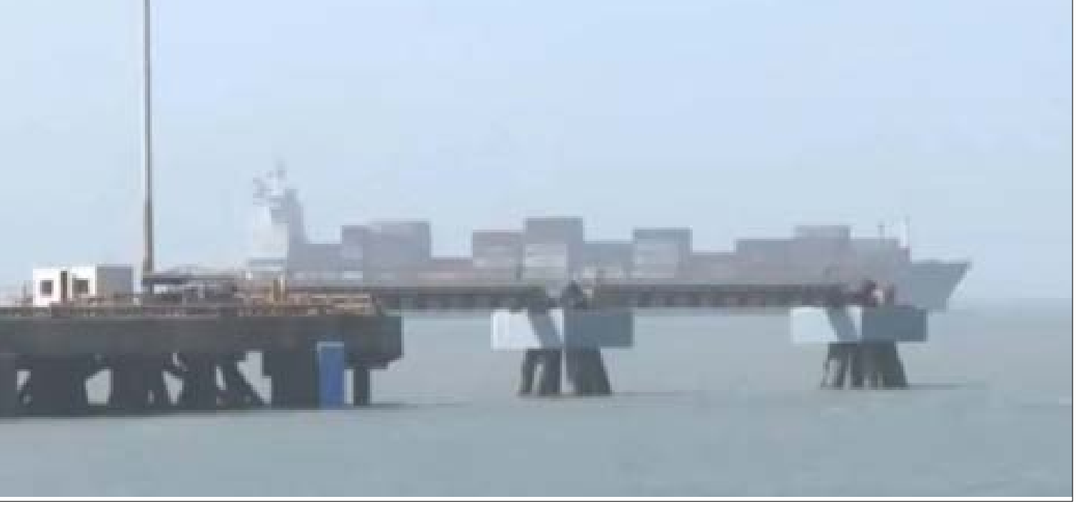
45,000 ಮೆಟ್ರಿಕ್ ಟನ್ ಎಲ್‌ಪಿಜಿ ಹೊತ್ತ ತಿವಾಲ್ ಹಡಗು ಗುಜರಾತ್‌ನ ಮುಂದೂರಿ ಬಂದರಿಗೆ ಬಂದು ತಲುಪಲಿದೆ. ಈ ಬಗ್ಗೆ ಮಾಹಿತಿ ನೀಡಿದ್ದ ಬಂದರು, ಹಡಗು ಮತ್ತು ಜಲಮಾರ್ಗಗಳ ಸಚಿವಾಲಯ, ಸುಮಾರು 92,700 ಮೆಟ್ರಿಕ್ ಟನ್ ಎಲ್‌ಪಿಜಿ ಹೊತ್ತ ನಂದಾ ದೇಖಿ ಮತ್ತು ತಿವಾಲ್ ಎಂಬ ಎರಡು ಹಡಗುಗಳು ಕಾಮರ್ಷ್ ಜಲಸಂಧಿಯನ್ನು ದಾಟಿ ಭಾರತಕ್ಕೆ ಬರುತ್ತಿವೆ. ತಿವಾಲ್ ಮಾರ್ಚ್ 16 ರಂದು ಮತ್ತು ನಂದಾ ದೇಖಿ ಮಾರ್ಚ್ 17 ರಂದು ಆಗಮಿಸುವ ನಿರೀಕ್ಷೆಯಿದೆ ಎಂದು ತಿಳಿಸಿತ್ತು.

ನವದೆಹಲಿ: ಪಶ್ಚಿಮ ಏಷ್ಯಾದಲ್ಲಿ ಹೆಚ್ಚುತ್ತಿರುವ ಸಂಘರ್ಷದಿಂದ ತತ್ತರಿಸಿರುವ ಭಾರತೀಯ ಪ್ರಜೆಗಳನ್ನು ರಕ್ಷಿಸಲು ಭಾರತ ಸರ್ಕಾರ ತನ್ನ ನಾಗರಿಕರಿಗೆ ಸಹಾಯಮಾಡುವ ಪ್ರಯತ್ನಗಳನ್ನು ಚುರುಕುಗೊಳಿಸಿರುವುದರಿಂದ, 550ಕ್ಕೂ ಹೆಚ್ಚು ಭಾರತೀಯ ಪ್ರಜೆಗಳನ್ನು ಇರಾನ್‌ನಿಂದ ಅಮೇರ್ನಿಯಾ ಮೂಲಕ ಸ್ಥಳಾಂತರಿಸಲಾಗಿದೆ. ಭೂ-ಗಡಿ ಸಾಂಕೇಯನ್ನು ಸುಗಮಗೊಳಿಸಿದ್ದಕ್ಕಾಗಿ ವಿದೇಶಾಂಗ ಸಚಿವ ಎಸ್. ಜೈಶಂಕರ್ ಅವರು ಸೋಮವಾರ ಅಮೇರ್ನಿಯಾ ಸರ್ಕಾರ ಮತ್ತು ಜನರಿಗೆ ಧನ್ಯವಾದ ಅರ್ಪಿಸಿದ್ದಾರೆ.