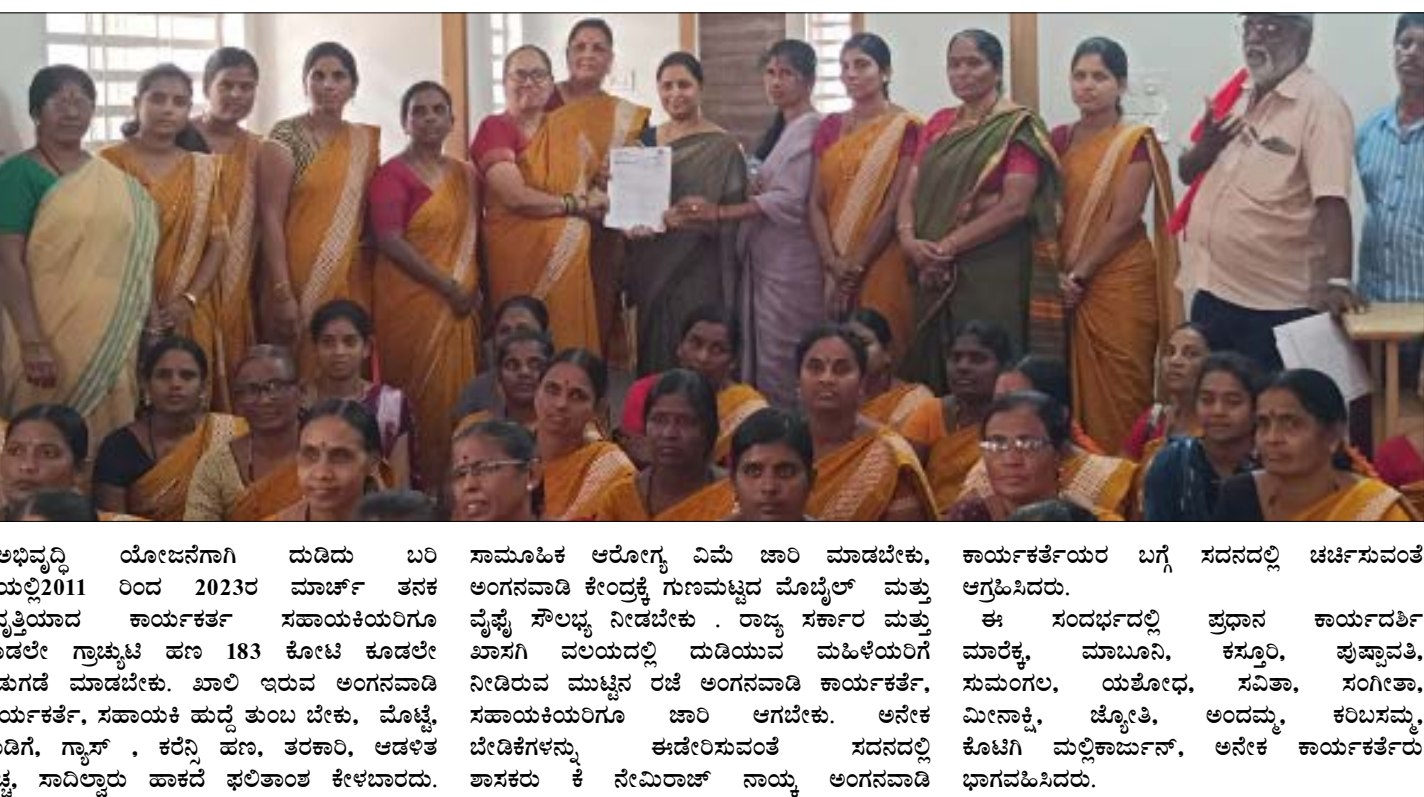
ಅಭಿವೃದ್ಧಿ ಯೋಜನೆಗಾಗಿ ದುಡಿದು ಬರಿ ಗೈಯಲ್ಲಿ 2011 ರಿಂದ 2023ರ ಮಾರ್ಚ್ ತನಕ ನಿವೃತ್ತಿಯಾದ ಕಾರ್ಯಕರ್ತೆ ಸಹಾಯಕಿಯರಿಗೂ ಕೂಡಲೇ ಗ್ರಾಚ್ಯುಟಿ ಹಣ 183 ಕೋಟಿ ಕೂಡಲೇ ಬಿಡುಗಡೆ ಮಾಡಬೇಕು.