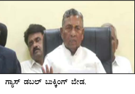
ಗ್ಯಾಸ್ ಡಬಲ್ ಬುಕ್ಯಿಂಗ್ ಬೇಡ.

ಅವರು, ಸಿಎಂ ಎರಡನೇ ಪತ್ರಿಕಾ ಸಭೆಯಲ್ಲಿ ಹೇಳಿದರು. ಪರಿಸ್ಥಿತಿ ಗಂಭೀರವಾಗಿದೆ. ಕೇಂದ್ರ ಸರ್ಕಾರ ಹೆಚ್ಚಿನ ಗಮನ ಕೊಡಬೇಕು. ಇಂದು ಸೆಕ್ರೆಟರಿ, ಕಮಿಷನರ್ ಹಾಗೂ ತೈಲ ಕಂಪನಿಗಳ ಮುಖ್ಯಸ್ಥರು ಜೊತೆ ಸಭೆ ನಡೆಸಲಾಯಿತು ಎಂದರು.