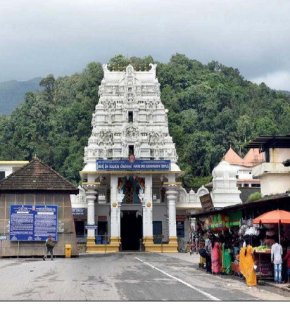
ಡಿ ಇದ್ದರೂ, ವಾರ್ಷಿಕ 150 ಕೋಟಿಗೂ ಹೆಚ್ಚು ಆದಾಯವಿದ್ದರೂ ಸಹ ಈ ಹಣವನ್ನು ದೇವಳದ ಅಭಿವೃದ್ಧಿ ಕಾರ್ಯಗಳಿಗೆ ಬಳಸಬೇಕೆಂದರೆ ಸರ್ಕಾರದ, ಹಣಕಾಸು ಇಲಾಖೆಯ ಅನುಮೋದನೆ ಕಡ್ಡಾಯವಾಗಿದೆ.

ದೇವಳದ ಸಮಗ್ರ ಅಭಿವೃದ್ಧಿಗಾಗಿ ಮಾರ್ಚ್ 17 ವರ್ಷವಾದರೂ ಇನ್ನು ಕೂಡ ಪೂರ್ಣವಾಗಿಲ್ಲ ಎಂಬುದು ಇಲ್ಲಿನ ವ್ಯವಸ್ಥೆಗೆ ಹಿಡಿದ ಕೈಗನ್ನಡಿಯಾಗಿದೆ. ಒಟ್ಟು 604 ಕೋಟಿ ರೂ ಕಾಮಗಾರಿಯಲ್ಲಿ ಈಗಾಗಲೇ ಎರಡು ಹಂತವನ್ನೂ ಪೂರ್ಣಗೊಳಿಸಿದ್ದು, ಈಗ ಮೂರನೇ ಹಂತದ ಕಾಮಗಾರಿಗಳ ಯೋಜನೆ, ಅಂದಾಜುಪಟ್ಟಿ ಸಿದ್ಧಗೊಳಿಸಿ ಪಿಡಬ್ಬುಡಿ ಇಲಾಖೆಯಿಂದ ಅನುಮೋದನೆ ಪಡೆದು ಸರ್ಕಾರಕ್ಕೆ ಸಲ್ಲಿಸಲಾಗಿದ್ದು ಸಹ ಇನ್ನು ಸಹ ಗ್ರೀನ್ ಸಿಗ್ನಲ್ ಸಿಕ್ಕಿಲ್ಲ. ಕುಕ್ಕೆ ಸುಬ್ರಹ್ಮಣ್ಯ ದೇವಸ್ಥಾನಕ್ಕೆ ಸಂಬಂಧಿಸಿದಂತೆ 600 ಕೋಟಿ ರೂ ಎಷ್ಟ