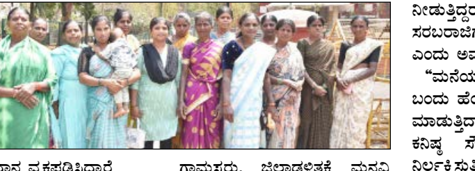
ಅಸಮಾಧಾನ ವ್ಯಕ್ತಪಡಿಸಿದ್ದಾರೆ. ಗ್ರಾಮಸ್ಥರು, ಜಿಲ್ಲಾಡಳಿತಕ್ಕೆ ಮನವಿ ಸಲ್ಲಿಸಿ ತಮ್ಮ ಅಳಲು ತೋಡಿಕೊಂಡರು. ಕಚೇರಿಗೆ ಆಗಮಿಸಿದ ಗ್ರಾಮದ ಕಳೆದ ನಾಲ್ಕೈದು ತಿಂಗಳಿನಿಂದ ನೂರಾರು ಮಹಿಳೆಯರು ಮತ್ತು

ತುಮಕೂರು “ನಮ್ಮ ಊರಿನಲ್ಲಿ ದಿನದಿಂದ ದಿನಕ್ಕೆ ಕುಡಿತದ ಹಾವಳಿ ಮಿತಿಯಿಲ್ಲದೆ. ಅಕ್ರಮ ಮದ್ಯ ಮಾರಾಟದಿಂದಾಗಿ ಯುವಕರು ಮತ್ತು ಅಮಾಯಕರು ದಾರಿ ತಪ್ಪುತ್ತಿದ್ದಾರೆ. ಹಗಲು-ರಾತ್ರಿಯವುದ್ದದ ಮದ್ಯದ ಚಟಕ್ಕೆ ಬಿದ್ದಿರುವುದರಿಂದ ಗ್ರಾಮದ ನೆಮ್ಮದಿಯೇ ಹರಾಜಾಗಿದೆ,” ಎಂದು ತುರುವೇಕೆರೆ ತಾಲ್ಲೂಕಿನ ನಾಗೇಶ್‌ನ ಪಾಳೆ ಗ್ರಾಮದ ಮಹಿಳೆಯರು ತೀವ್ರ