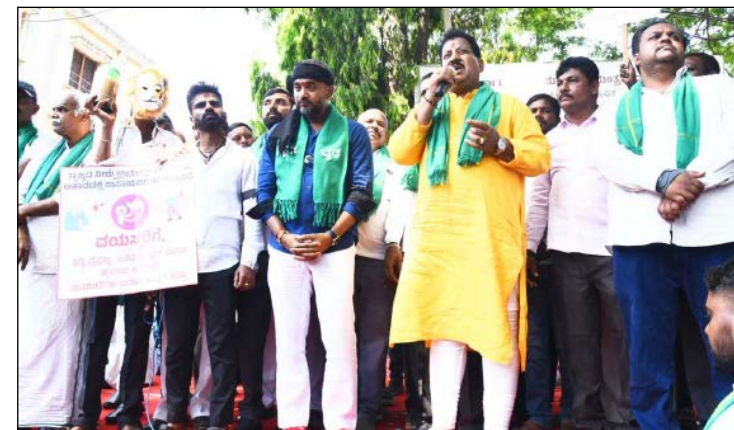
ಚಿಕ್ಕಬಳ್ಳಾಪುರಕ್ಕೆ ಬರುತ್ತಿರುವ ಬೆಂಗಳೂರಿನ ಕೊಳಚೆ ನೀರಿನಿಂದ ಅಂತರ್ಜಲ ಕಲುಷಿತಗೊಂಡಿದೆ. ಈ ನೀರು ಕುಡಿದ ಜನರಿಗೆ ಕ್ಯಾನ್ಸರ್ ಮತ್ತು ಕಿಡಿ ಸಮಸ್ಯೆಗಳು