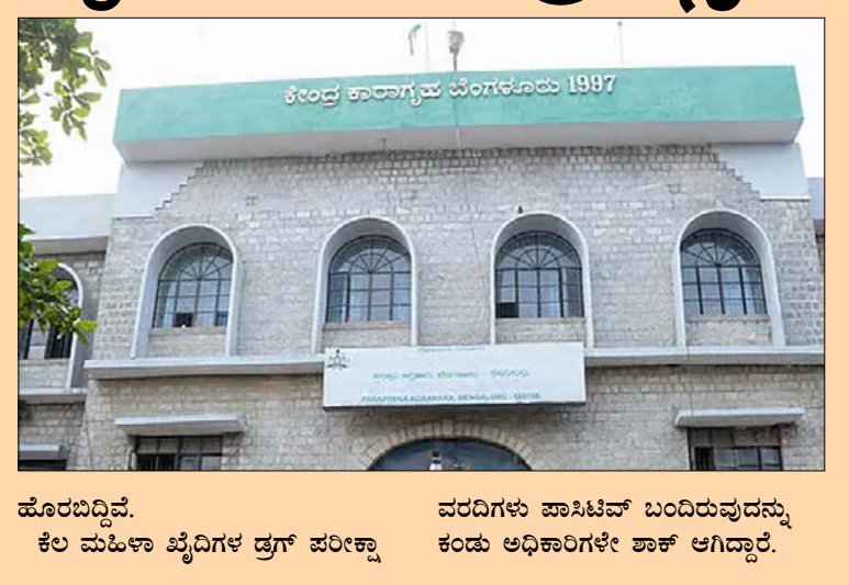
ಹೊರಬಿದ್ದವು. ಕೆಲ ಮಹಿಳಾ ವೈದಿಗಳ ಡ್ರಗ್ಸ್ ಪರೀಕ್ಷಾ ವರದಿಗಳು ಪಾಸಿಟಿವ್ ಬಂದಿರುವುದನ್ನು ಕಂಡು ಅಧಿಕಾರಿಗಳೇ ಶಾಕ್ ಆಗಿದ್ದಾರೆ.