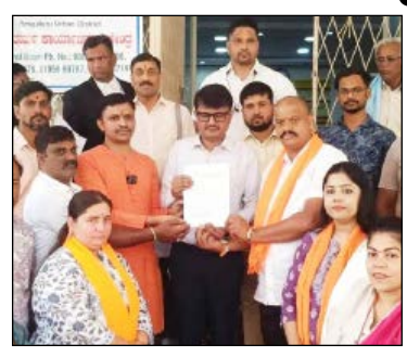
“ಹಿಂದೂ ಪರಂಪರೆಯಲ್ಲಿ ಹಸುವನ್ನು ಗೋಮಾತೆ ಎಂದು ಪೂಜಿಸಲಾಗುತ್ತದೆ.