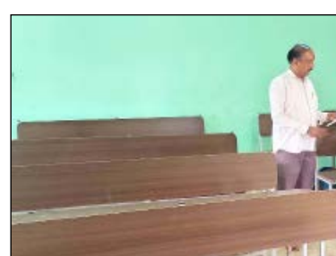
ಕೇಂದ್ರಗಳು, ಹೊಸಕೋಟೆ 12 ಕೇಂದ್ರಗಳು ನೋಂದಾಯಿಸಿಕೊಂಡಿದ್ದಾರೆ. ಪೈಟೆಕ್ ಕರ್ನಾಟಕ ಮತ್ತು ಬಿಗಿ ಭದ್ರತೆ: ಪರೀಕ್ಷೆಯಲ್ಲಿ ಅಕ್ರಮ ನಡೆಯದಂತೆ ತಡೆಯಲು ಪ್ರತಿಯೊಂದು ಪರೀಕ್ಷಾ ಕೇಂದ್ರದಲ್ಲೂ ಸಿ.ಪಿ.ಎಸ್‌ಎಲ್‌ಸಿ ಮತ್ತು ಸಿ.ಪಿ.ಎಸ್‌ಎಲ್‌ಸಿ ಅಳವಡಿಸಲಾಗಿದೆ. ವಿಶೇಷವಾಗಿ ಜಿಲ್ಲಾಧಿಕಾರಿಗಳ ಕಚೇರಿಯಿಂದಲೇ ‘ವೆಬ್ ಕ್ಯಾಂಪಿಂಗ್’ ಮೂಲಕ ಪ್ರತಿ 4-5 ಕೊಠಡಿಗಳ ಮೇಲೆ ನಿಗಾ ಇಡಲು ಪ್ರತ್ಯೇಕ ಸಿಬ್ಬಂದಿಯನ್ನು ನೇಮಿಸಲಾಗಿದೆ. ಪರೀಕ್ಷಾ ಕೇಂದ್ರದ ಸುತ್ತ 144ನೇ ವಿಧಿಯನ್ವಯ ನಿಷೇಧಾಜ್ಞೆ

ವಿಜಯಪುರ ಇಂದಿನಿಂದ ಪ್ರಾರಂಭವಾಗಲಿರುವ 2026-27ನೇ ಸಾಲಿನ ಎಸ್‌ಎಸ್‌ಎಲ್‌ಸಿ ಪರೀಕ್ಷೆಗೆ ಬೆಂಗಳೂರು ಗ್ರಾಮಾಂತರ ಜಿಲ್ಲೆಯಾದ್ಯಂತ ಶಿಕ್ಷಣ ಇಲಾಖೆಯು ಸರ್ವಸನ್ನದವಾಗಿದೆ ಎಂದು ಸಾರ್ವಜನಿಕ ಶಿಕ್ಷಣ ಇಲಾಖೆಯ ಉಪನಿರ್ದೇಶಕ (ಡಿಡಿಪಿಪಿ) ಬೈಲಾಜಿಪುರ ತಿಳಿಸಿದ್ದಾರೆ. ಜಿಲ್ಲೆಯಲ್ಲಿ ಒಟ್ಟು 278 ಪ್ರೌಢಶಾಲೆಗಳಿದ್ದು, ಪರೀಕ್ಷೆಗಾಗಿ 52 ಕೇಂದ್ರಗಳನ್ನು ಸ್ಥಾಪಿಸಲಾಗಿದೆ. ಒಟ್ಟು 13,446 ವಿದ್ಯಾರ್ಥಿಗಳಿಗೆ ಪರೀಕ್ಷೆಗೆ ನೋಂದಾಯಿಸಿಕೊಂಡಿದ್ದಾರೆ. ತಾಲೂಕುವಾರು ಪರೀಕ್ಷಾ ಕೇಂದ್ರಗಳು: ದೇವನಹಳ್ಳಿ 13 ಕೇಂದ್ರಗಳು, ದೊಡ್ಡಬಳ್ಳಾಪುರ 14 ಕೇಂದ್ರಗಳು, ನೆಲಮಂಗಲ 13