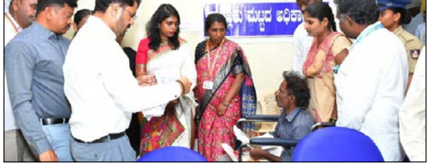
ಅರ್ಜಿದಾರರ ಅಲೆ, 225 ಸಮಸ್ಯೆಗಳ ಮಹಾಪೂರ: ಜನಸಂಪರ್ಕ ಸಭೆಯಲ್ಲಿ ಒಟ್ಟು 225 ಅರ್ಜಿಗಳು ಸಲ್ಲಿಕೆಯಾದವು. ಕಂದಾಯ ಇಲಾಖೆಗೆ ಸಂಬಂಧಿಸಿದ 141 ಅರ್ಜಿಗಳಿದ್ದರೆ, ತಾಲ್ಲೂಕು ಪಂಚಾಯತಿಗೆ 36 ಅರ್ಜಿಗಳು ಬಂದಿದ್ದವು. ಈ ಪೈಕಿ 27 ಅರ್ಜಿಗಳಿಗೆ ಜಿಲ್ಲಾಧಿಕಾರಿಗಳು ಸ್ಥಳದಲ್ಲೇ ಪರಿಹಾರ ಸೂಚಿಸಿದರು. ಉಳಿದ ಅರ್ಜಿಗಳನ್ನು ವಾರದೊಳಗೆ ವಿಲೇವಾರಿ ಮಾಡುವಂತೆ ತಂತ್ರಾಂಶದ ಮೂಲಕ ಆಯಾ ಇಲಾಖೆಗಳಿಗೆ ಕಳುಹಿಸಲಾಯಿತು.