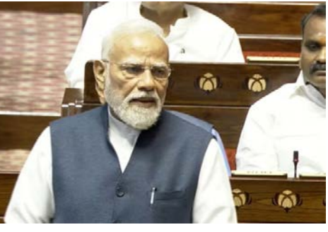
ರಾಜ್ಯಸಭೆಯ ಹಿರಿಯರ ಸದನವಾಗಿದ್ದು, ಇಲ್ಲಿನ ಚರ್ಚೆಗಳು ಗುಣಮಟ್ಟದಿಂದ ಕೂಡಿರಬೇಕು. ನಿವೃತ್ತ ಸದಸ್ಯರು ತಮ್ಮ ಕ್ಷೇತ್ರಗಳಲ್ಲಿ ಈ ಅನುಭವವನ್ನು ಜನರಿಗೆ ತಲುಪಿಸಬೇಕು ಎಂದು ಅವರು ಆಶಿಸಿದರು.

ನವದೆಹಲಿ: ರಾಜ್ಯಸಭೆಯ 37 ಸದಸ್ಯರ ನಿವೃತ್ತಿಯ ಹಿನ್ನೆಲೆಯಲ್ಲಿ ಸದನವು ಇಂದು ಭಾವುಕ ಕ್ಷಣಕ್ಕೆ ಸಾಕ್ಷಿಯಾಗಿತ್ತು. ನಿವೃತ್ತರಾಗುತ್ತಿರುವ ಸದಸ್ಯರ ಸೇವೆಯನ್ನು ಶ್ಲಾಘಿಸಿದ ಪ್ರಧಾನಿ ಮೋದಿ, ಸದನಕ್ಕೆ ಅವರು ನೀಡಿದ ಕೊಡುಗೆಗಳು ಮುಂದಿನ ಪೀಳಿಗೆಗೆ ಮಾರ್ಗದರ್ಶಿಯಾಗುತ್ತವೆ ಎಂದು ತಿಳಿಸಿದರು. "ಜ್ಞಾನಕ್ಕಿಂತ ಅನುಭವಕ್ಕೆ ಶಕ್ತಿ ಹೆಚ್ಚು. ಶೈಕ್ಷಣಿಕ ಜ್ಞಾನವು ಸೀಮಿತವಾಗಿರುತ್ತದೆ, ಆದರೆ ಸದಸ್ಯರು ಇಲ್ಲಿ ಕಳೆದ ಸಮಯ ಮತ್ತು ಪಡೆದ ಅನುಭವವು ದೇಶದ ನೀತಿ ನಿರೂಪಣೆಯಲ್ಲಿ ಪ್ರಮುಖ ಪಾತ್ರ ವಹಿಸಿದೆ" ಎಂದು ಪ್ರಧಾನಿ ಹೇಳಿದರು.