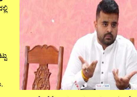
ಮೇಲೆಗೆ ಎಫ್‌ಐಆರ್ ದಾಖಲಾಗಿತ್ತು. ಯೋಜನೆಯ ಚುನಾವಣೆ ವೇಳೆ ಅಶ್ಲೀಲ ವಿಡಿಯೋ ವೈರಲ್ ಆಗಿತ್ತು. ಎಸ್‌ಐಟಿ ತನಿಖೆ ವೇಳೆ ಮಹತ್ವದ ವಿಚಾರಗಳು ಬೆಳಕಿಗೆ ಬಂದಿವೆ.

ಬೆಂಗಳೂರು/ಹಾಸನ: ಮಾಜಿ ಸಂಸದ ಪ್ರಜ್ವಲ್ ರೇವಣ್ಣ ಅಶ್ಲೀಲ ವಿಡಿಯೋ ವೈರಲ್ ಪ್ರಕರಣದಲ್ಲಿ ಪೊನ್‌ಡ್ರೈವ್ ಹಂಚಿಕೆ ಸಂಬಂಧ ಎಸ್‌ಐಟಿ ಚಾರ್ಜ್‌ಶೀಟ್ ಸಲ್ಲಿಸಿದೆ. ಪೊನ್‌ಡ್ರೈವ್ ಹಂಚಿಕೆ ಪ್ರಕರಣದಲ್ಲಿ ಹಾಸನ ಸಿವಿಲ್ ಕೋರ್ಟ್‌ಗೆ ಎಸ್‌ಐಟಿ 13,712 ಪುಟಗಳ ಚಾರ್ಜ್ ಶೀಟ್ ಸಲ್ಲಿಕೆ ಮಾಡಿದೆ. ಒಟ್ಟು 39 ಆರೋಪಿಗಳ ವಿರುದ್ಧ ದೋಷಾರೋಪ ಪಟ್ಟಿ ಸಲ್ಲಿಸಿದೆ. ಅಶ್ಲೀಲ ವಿಡಿಯೋ ಹಂಚಲು ಆರೋಪಿಗಳು 70 ಪೊನ್‌ಡ್ರೈವ್ ಖರೀದಿಸಿದ್ದರು. ಹಾಸನದಲ್ಲೇ 70 ಪೊನ್‌ಡ್ರೈವ್ ಖರೀದಿ ಮಾಡಿರುವುದು ತನಿಖೆಯಿಂದ ಬಯಲಾಗಿದೆ. ಪ್ರಕರಣದಲ್ಲಿ 52 ಮಂದಿ ಹೆಸರು ಉಲ್ಲೇಖ ಮಾಡಲಾಗಿತ್ತು. 52 ಮಂದಿಯಲ್ಲಿ 39 ಮಂದಿ ಆರೋಪ ಸಾರಿಲಾಗಿದೆ. ವಕೀಲ ಪೂರ್ಣಚಂದ್ರ ನೀಡಿದ ದೂರಿನ