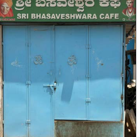
ಹೋಟೆಲ್ ಮಾಲೀಕರೂ ಸಂಕಷ್ಟದಲ್ಲಿದ್ದು, "ಸಿಲಿಂಡರ್ ಸಿಗುವುದಿಲ್ಲ, ಸಿಕ್ಕರೂ ಬೆಲೆ ಏರಿಕೆಯಾಗಿದೆ. ಈ ಪರಿಸ್ಥಿತಿಯಲ್ಲಿ ವ್ಯವಹಾರ ನಡೆಸುವುದು ಕಷ್ಟವಾಗಿದೆ," ಎಂದು ತಮ್ಮ ಅಳಲು ವ್ಯಕ್ತಪಡಿಸಿದ್ದಾರೆ. ಕಾರ್ಯದರ್ಶಿ ಆರೋಪಣೆ: ನಗರದಲ್ಲಿ ಉಂಟಾಗಿರುವ ಸಿಲಿಂಡರ್ ಕೊರತೆಗೆ ಕಾರಣ ತಂದೆ ದಂಧೆ ಕಾರಣ ಎಂಬ ಗಂಭೀರ ಆರೋಪಗಳು ಕೇಳಿಬರುತ್ತಿವೆ. ಕೆಲವು ಏಜೆನ್ಸಿಗಳು ಮತ್ತು ಮಧ್ಯವರ್ತಿಗಳು ವಾಣಿಜ್ಯ ಸಿಲಿಂಡರ್‌ಗಳನ್ನು ಅಧಿಕ

ಬಂಗಾರಪೇಟೆ ಯುದ್ಧದ ಹಿನ್ನೆಲೆ ನಗರದಲ್ಲಿ ವಾಣಿಜ್ಯ ಗ್ಯಾಸ್ ಸಿಲಿಂಡರ್‌ಗಳ ಭಾರೀ ಕೊರತೆ ಉಂಟಾಗಿ ಹೋಟೆಲ್ ಉದ್ಯಮ ಸಂಪೂರ್ಣ ಅಸ್ವಸ್ಥಗೊಂಡಿದೆ. ಸಣ್ಣ ಹೋಟೆಲ್‌ಗಳು ಒಂದರ ಹಿಂದೆ ಒಂದಾಗಿ ಬಾಗಿಲು ಮುಚ್ಚಿಟ್ಟಿರುವುದರಿಂದ ಜನಜೀವನಕ್ಕೂ ಗಂಭೀರ ಪರಿಣಾಮ ಉಂಟಾಗಿದೆ. ವಾಣಿಜ್ಯ ಸಿಲಿಂಡರ್‌ಗಳ ಬೇಡಿಕೆ ಹೆಚ್ಚಿದರೂ ಸರಬರಾಜು ಸಮರ್ಪಕವಾಗಿ ಆಗದೆ ಹಿನ್ನೆಲೆಯಲ್ಲಿ ಅನೇಕ ಸಣ್ಣ ಹೋಟೆಲ್‌ಗಳು ಕಾರ್ಯನಿರ್ವಹಣೆ ನಿಲ್ಲಿಸಿವೆ. ದಿನಗೂಲಿ ಕಾರ್ಮಿಕರು, ಕಚೇರಿ ನೌಕರರು, ವಿದ್ಯಾರ್ಥಿಗಳು ಸೇರಿದಂತೆ ಮಧ್ಯಮ ವರ್ಗದ ಜನತೆ ಹೋಟೆಲ್‌ಗಳ ಮೇಲೆ ಅವಲಂಬಿತರಾಗಿದ್ದು, ಈಗ ಊಟಕ್ಕೂ ಪರದಾಡುವ ಪರಿಸ್ಥಿತಿ ನಿರ್ಮಾಣವಾಗಿದೆ. ಇದಕ್ಕೂ ಮೀರಿಯಾಗಿ, ಕಾರ್ಯನಿರ್ವಹಿಸುತ್ತಿರುವ ಕೆಲ ದೊಡ್ಡ ಹೋಟೆಲ್‌ಗಳಲ್ಲಿಯೂ ಸಂಪೂರ್ಣ ಅಹಾರ ಲಭ್ಯವಿಲ್ಲ. ದೋಸೆ, ರೊಟ್ಟಿ, ಚಪಾತಿ ಮೊದಲಾದ ಪ್ರಮುಖ ತಿನಿಸುಗಳು ಸಿಗದೆ, ಮೊಸರನ್ನಕ್ಕೆ ಮಾತ್ರ ಸೇವೆ ಸೀಮಿತಗೊಂಡಿರುವುದು ಗ್ರಾಹಕರ ಅಸಮಾಧಾನಕ್ಕೆ ಕಾರಣವಾಗಿದೆ. "ಬೆಳಿಗ್ಗೆ ತಿಂಡಿ ಸಿಗುತ್ತಿಲ್ಲ, ಮಧ್ಯಾಹ್ನವೂ ಸರಿಯಾಗಿ ಊಟ ಸಿಗದೆ ಪರಿಸ್ಥಿತಿ ಬಂದಿದೆ. ಇದು ಸಾಮಾನ್ಯ ಜನರ ಬದುಕನ್ನೇ ಸಂಕಷ್ಟಕ್ಕೆ ತಳ್ಳಿದೆ," ಎಂದು ಸ್ಥಳೀಯರು ಆಕ್ರೋಶ ವ್ಯಕ್ತಪಡಿಸಿದ್ದಾರೆ.