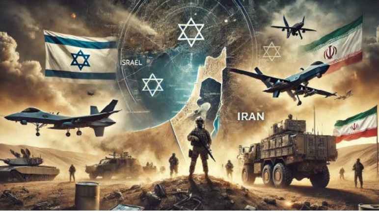
ರಾಜತಾಂತ್ರಿಕ ಪ್ರಯತ್ನಗಳ ಬಗ್ಗೆ ನಿರೀಕ್ಷಿಸಿ ವಿವರಗಳನ್ನು ನೀಡದಿದ್ದರೂ, ವಾರವಿಡೀ ಚರ್ಚೆಗಳು ಮುಂದುವರಿಯುತ್ತವೆ ಎಂದು ಟ್ರಂಪ್ ಹೇಳಿದ್ದಾರೆ. "ಮಧ್ಯಪ್ರಾಚ್ಯದಲ್ಲಿ ನಮ್ಮ ಹಗಿನದ ಸಂಪೂರ್ಣ ಮತ್ತು ಸಂಪೂರ್ಣ ಪರಿಹಾರದ ಕುರಿತು ಕಳೆದ ಎರಡು ದಿನಗಳಲ್ಲಿ ಅಮೆರಿಕ

ಘೋಷಣೆ ಮಾಡಿದ್ದು ಆ ಮೂಲಕ ಯುದ್ಧ ನಿಲ್ಲಿಸಲು ಜಾಗತಿಕ ಸಮುದಾಯ ಮಾಡುತ್ತಿರುವ ಪ್ರಯತ್ನಕ್ಕೆ ಆರಂಭಿಕ ಯಶಸ್ಸು ಸಿಕ್ಕಂತಾಗಿದೆ. ಟ್ರಂಪ್ ಸೋಮವಾರ ತಮ್ಮ ಟ್ವಿಟ್ ಸೋಷಿಯಲ್ ಪ್ಲಾಟ್‌ಫಾರ್ಮ್ ಮೂಲಕ ಈ ಹೊಸ ಘೋಷಣೆ ಹಂಚಿಕೊಂಡಿದ್ದು, ಎಲ್ಲಾ ದೊಡ್ಡ ಆಕ್ರಮಣಗಳಿಗೆ ಬರೆಯಲಾದ ಸಂದೇಶದಲ್ಲಿ, ಅಮೆರಿಕ ಮತ್ತು ಇರಾನ್ "ತುಂಬಾ ಉತ್ತಮ ಮತ್ತು ಉತ್ತಮ ಸಂಭಾಷಣೆಗಳಲ್ಲಿ" ತೊಡಗಿಸಿಕೊಂಡಿವೆ ಎಂದು ಹೇಳಿದ್ದಾರೆ. ಇದು ಸಂಘರ್ಷದ "ಸಂಪೂರ್ಣ ಪರಿಹಾರ"ಕ್ಕೆ ಕಾರಣವಾಗ ಬಹುದು ಎಂದು ಅವರು ನಂಬಿರುವುದಾಗಿ ಬರೆದಿದ್ದಾರೆ.