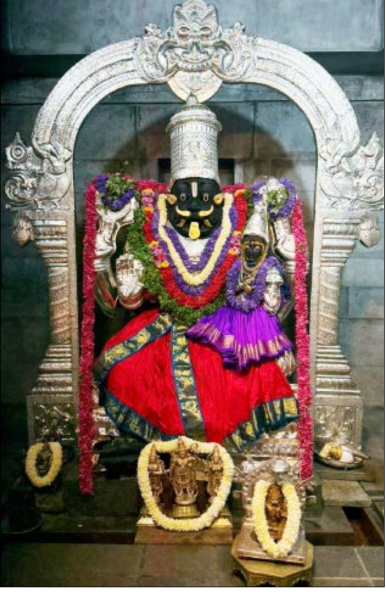
ಬೆಂಗಳೂರಿನ ಶ್ರೀಮದುತರಾದಿ ಮಠದಲ್ಲಿ ಸೋಮವಾರದಂದು ಶ್ರೀ ದಿಗ್ವಿಜಯ ಲಕ್ಷ್ಮಿ ನರಸಿಂಹ ದೇವರ ಪೂಜೆ ಅಲಂಕಾರ ದರ್ಶನ ಭಕ್ತರ ಗಮನ ಸೆಳೆಯಿತು.