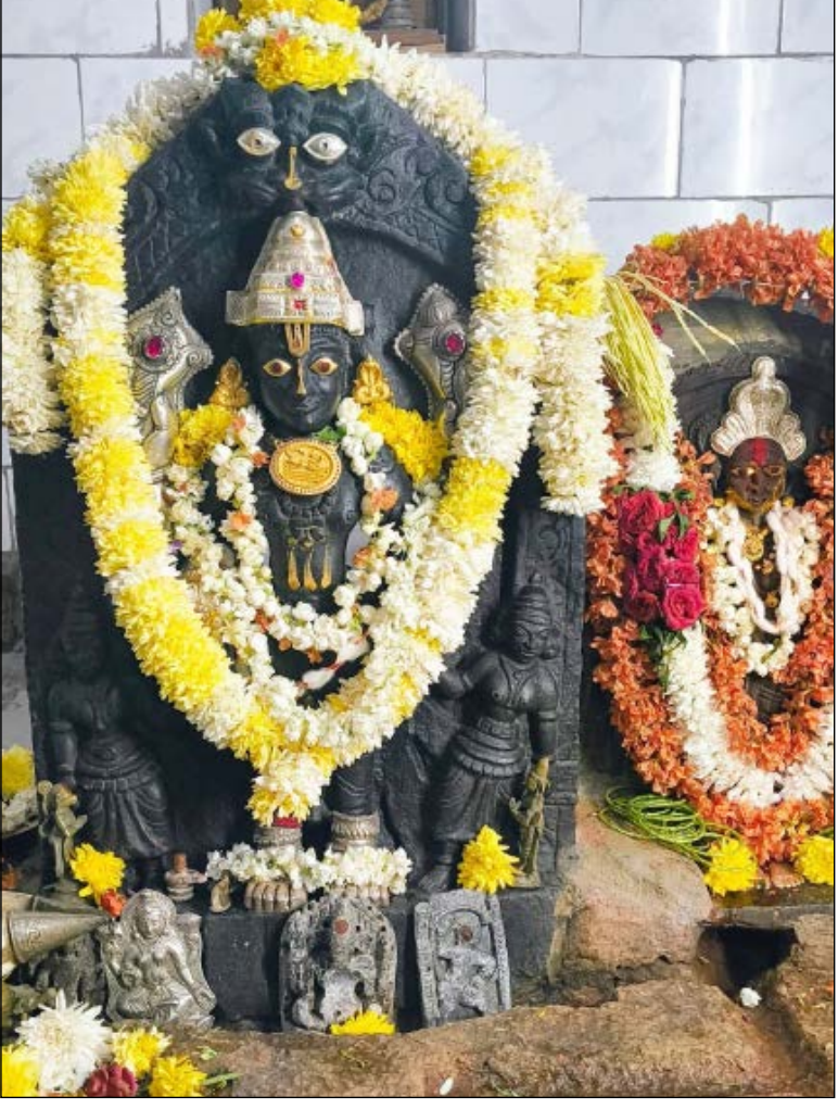
ಹಲಿವುಡ್ ತೆವರಾರು ರಾಯಚೂರು ಜಿಲ್ಲೆಯ ಮಾಸ್ತಿ ತಾಲೂಕಿನ ಕಲ್ಲೂರು ಗ್ರಾಮದಲ್ಲಿ ಸೋಮವಾರದಂದು ಶ್ರೀ ಮಹಾಲಕ್ಷ್ಮೀ ಅಮ್ಮನವರ ಪೂಜೆ ಅಲಂಕಾರ ದರ್ಶನಗೈದ ಭಕ್ತರು ಪುನೀತರಾದರು.