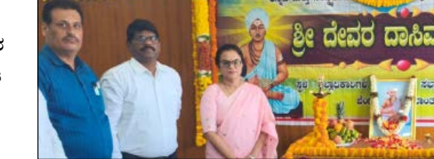
ಜಿಲ್ಲಾಧಿಕಾರಿಗಳ ಕಚೇರಿ ಸಭಾಂಗಣದಲ್ಲಿ ದಾಸಿಮಯ್ಯ ಜಯಂತಿ ಕಾರ್ಯಕ್ರಮದಲ್ಲಿ ದಾಸಿಮಯ್ಯನವರ ಭಾವಚಿತ್ರಕ್ಕೆ ಪುಷ್ಪಾರ್ಪಣೆ