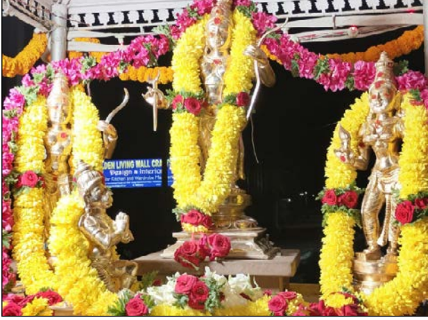
ನಡೆದು ವರ್ಷವಾದ ಹನ್ನೆರಡು ಈ ಬಾರಿ ರಾಮೋತ್ಸವವು ಮತ್ತಷ್ಟು ಅದ್ವೈತಿಯಾಗಿ ನಡೆಯಲಿದೆ. ಇದೇ 25ರಂದು ಗಣಪತಿ ಪ್ರಾರ್ಥನೆ, ಮೂಲದೇವರ ಪ್ರಾರ್ಥನೆ, ಕಳಸಸ್ಥಾಪನೆ, ಸ್ವಸ್ತಿವಾಚನ, ಅಗ್ನಿ ಪ್ರತಿಷ್ಠೆ, ಗಣಪತಿ, ನವಗೃಹ, ದಿಕ್ಪಾಲಕ, ಸುಬ್ರಹ್ಮಣ್ಯ.

ಕೋಲಾರ ನಗರದ ಪಿಸಿ ಬಡಾವಣೆಯಲ್ಲಿನ ಅಂಚೆ ಕಚೇರಿ ಎದುರಿನಲ್ಲಿರುವ ಕೋದಂಡರಾಮಸ್ವಾಮಿ ದೇವಾಲಯದ 44ನೇ ವರ್ಷದ ರಾಮೋತ್ಸವದ ಅಂಗವಾಗಿ ಇದೇ 25 ರಿಂದ 31 ರವರೆಗೂ ವಿಶೇಷ ಕಾರ್ಯಕ್ರಮಗಳು ನಡೆಯಲಿದ್ದು, ಮಂಗಳವಾರದಂದು ನೂತನ ಉತ್ಸವ ಮೂರ್ತಿಗಳ ಗ್ರಾಮ ಪ್ರದಕ್ಷಿಣೆ ನಡೆಸಿ ದೇವಾಲಯಕ್ಕೆ ಅದ್ವೈತಿಯಾಗಿ ಸ್ವಾಗತಿಸಲಾಯಿತು. ಪುನರ್ ಜೀರ್ಣೋದ್ಧಾರ ಮತ್ತು ನೂತನ ನವಗೃಹ, ನೂತನ ಧ್ವಜಸ್ತಂಭ, ನೂತನ ಸೂರ್ಯ ಸಂಸ್ಥ, ಗುರುಡವಾಹನ ಹಾಗೂ ಕೋದಂಡರಾಮಸ್ವಾಮಿಯ 21 ಅಡಿಗಳ ಭವ್ಯ ಮೂರ್ತಿಯ ಸಂಪೂರ್ಣತೆ ಮಾಡಿಕೊಟ್ಟುಕೊಡುವ ಕಾರ್ಯಕ್ರಮವನ್ನು ಇದೇ 25ರಂದು ಗಣಪತಿ ಪ್ರಾರ್ಥನೆ, ಮೂಲದೇವರ ಪ್ರಾರ್ಥನೆ, ಕಳಸಸ್ಥಾಪನೆ, ಸ್ವಸ್ತಿವಾಚನ, ಅಗ್ನಿ ಪ್ರತಿಷ್ಠೆ, ಗಣಪತಿ, ನವಗೃಹ, ದಿಕ್ಪಾಲಕ, ಸುಬ್ರಹ್ಮಣ್ಯ.