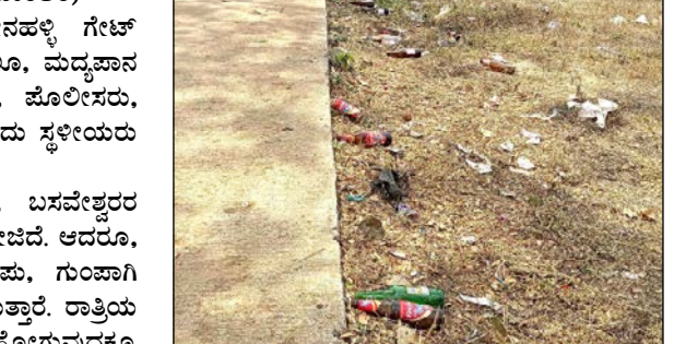
ಹೋಗುತ್ತಾರೆ. ಇದರಿಂದ ಮೂಳೆಗಳ ತಿನ್ನುವುದಕ್ಕೆ ಬರುವ ನಾಯಿಗಳ ಕಾಟವೂ ಜಾಸ್ತಿಯಾಗಿದೆ. ಮದ್ಯಪಾನ ಮಾಡುವವರನ್ನು ಮಾತನಾಡಿಸುವುದಕ್ಕೂ ಭಯವಾಗುತ್ತದೆ. ಕುಡಿದು ಚೋರಾಗಿ ಕೂಗುತ್ತಾರೆ. ಕಿಟ್ಟಿ ಕಿಟ್ಟಿದಾಗ ಮಾತನಾಡಿಕೊಳ್ಳುತ್ತಾರೆ. ಸಮೀಪದ ಮನೆಗಳಲ್ಲಿ ಇರುವುದಕ್ಕೆ ಕಷ್ಟವಾಗುತ್ತಿದೆ ಎಂದು ಸ್ಥಳೀಯರು

ವಿಜಯಪುರ (ಬೆಂಗಳೂರು ಗ್ರಾಮಾಂತರ) ಪಟ್ಟಣದ ಹೊರವಲಯದ ಚಂದೇನಹಳ್ಳಿ ಗೇಟ್ ನಲ್ಲಿರುವ ಬಸವ ಕಲ್ಯಾಣಮಠದ ಸುತ್ತಲೂ, ಮದ್ಯಪಾನ ಮಾಡುವವರ ಸಂಖ್ಯೆ ಜಾಸ್ತಿಯಾಗಿದ್ದು, ಪೊಲೀಸರು, ಬೀಟ್ ವ್ಯವಸ್ಥೆಯನ್ನು ಮಾಡಬೇಕು ಎಂದು ಸ್ಥಳೀಯರು ಒತ್ತಾಯಿಸಿದ್ದಾರೆ. ಬಸವ ಕಲ್ಯಾಣ ಮಠದ ಮುಂದೆ, ಬಸವೇಶ್ವರರ ದೇವಾಲಯವಿದೆ, ಪಕ್ಕದಲ್ಲಿ ಪದವಿ ಕಾಲೇಜಿದೆ. ಆದರೂ, ಸಂಜೆಯಾಗುತ್ತಿದ್ದಂತೆ ಕುಡುಕರು, ಗುಂಪು, ಗುಂಪಾಗಿ ಬಂದು ರಸ್ತೆಯಲ್ಲಿ ಕುಳಿತು ಕುಡಿಯುತ್ತಿರುತ್ತಾರೆ. ರಾತ್ರಿಯ ವೇಳೆ ಬಸವಕಲ್ಯಾಣ ಮಠದ ಕಡೆಗೆ ಹೋಗುವುದಕ್ಕೂ ಭಯವಾಗುತ್ತದೆ ಎಂದು ಮಠದ ಭಕ್ತರು ಆತಂಕ ವ್ಯಕ್ತಪಡಿಸಿದರು. ಬಸವೇಶ್ವರ ದೇವಾಲಯದ ಮುಂಭಾಗದಲ್ಲಿ ಕುಳಿತು, ಮದ್ಯಪಾನ ಮಾಡಿ, ಬಾಟಲೆಗಳನ್ನು ರಸ್ತೆಯಲ್ಲಿ ಒಡೆದು ಹಾಕಿರುತ್ತಾರೆ. ವಾಂಸಾಹಾರವನ್ನು ತಂದು, ಇಲ್ಲೆ ತಿಂದು, ಮೂಳೆಗಳನ್ನು ಮಠದ ಸಮೀಪದಲ್ಲಿ ಎಸೆದು