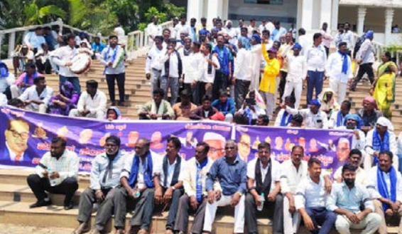
ಸ್ಥಿತಿಯಲ್ಲಿರುವ ಮಾದಿಗಿ ಸಮುದಾಯಕ್ಕೆ ಜನಸಂಖ್ಯೆಗನುಗುಣವಾಗಿ ಉದ್ಯೋಗ ದೊರೆಯಬೇಕು. ಸರ್ಕಾರವು ತಾಂತ್ರಿಕ ಅಡಚಣೆಯ ನೆಪ ಹೇಳುತ್ತಿರುವುದು ಸಮುದಾಯವನ್ನು ವಂಚಿಸುವ ರಾಜಕೀಯ ಹುನ್ನಾರವಾಗಿದೆ." ಎಂದು ಕಿಡಿಕಾರಿದರು. ಕರ್ನಾಟಕ ದಲಿತ ಸಂಘರ್ಷ