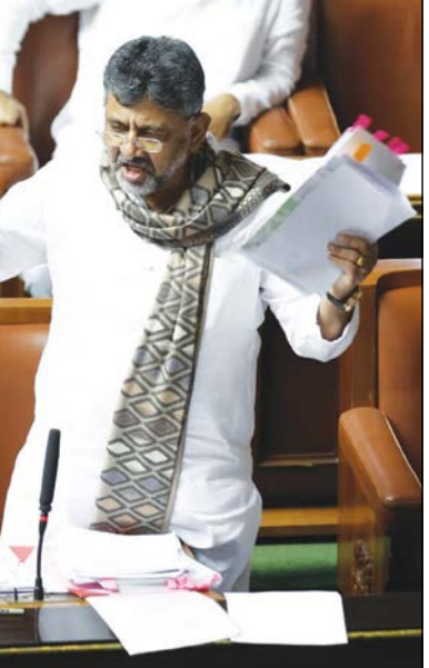
ಚರ್ಚೆ ಈಗ ನಕರಾತ್ಮಕವಾಗಿ ಹೋಗುತ್ತಿದೆ. “ಕುಮಾರಸ್ವಾಮಿ ಅವರಿಗೆ ಇದೇ ಸದನದಲ್ಲಿ ಒಮ್ಮೆ ಡಿವಿಬಿ ಅವರ