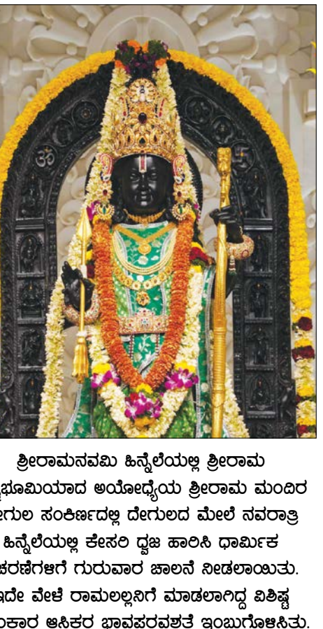
ಶ್ರೀರಾಮನವಮಿ ಹಿನ್ನೆಲೆಯಲ್ಲಿ ಶ್ರೀರಾಮ ಜನ್ಮಭೂಮಿಯಾದ ಅಯೋಧ್ಯೆಯ ಶ್ರೀರಾಮ ಮಂದಿರ ದೇಗುಲ ಸಂರಕ್ಷಣೆಗಾಗಿ ದೇಗುಲದ ಮೇಲೆ ನವರಾತ್ರಿ ಹಿನ್ನೆಲೆಯಲ್ಲಿ ಕೇರಲ ರಾಜ್ಯ ಹಾಲಿ ರಾಜ್ಯಪಾಲರ ಅತಿಥಿಗಳಿಗೆ ಗುರುವಾರ ಜಾಲನೆ ನೀಡಲಾಯಿತು. ಇದೇ ವೇಳೆ ರಾಮಲಲ್ಲೂರಿಗೆ ಮಾಡಲಾಗಿದ್ದ ವಿಶಿಷ್ಟ ಅಲಂಕಾರ ಅಕ್ಷರಕರ ಭಾವಪರವಶತೆ ಇಂಗೂಣಿಸಿತ್ತು.

ಗಾರ್ಡ್ ಕಾರ್ಪ್ ಪ್ರಕಾರ, ಯುನೈಟೆಡ್ ಅರಬ್ ಎಮಿರೇಟ್ಸ್ನ ಶಾರ್ಜಾದಿಂದ ಕರಾಚಿ ಕಡೆಗೆ ಪ್ರಯಾಣಿಸುತ್ತಿದ್ದ ಹಡಗು ಸಾಗಾಟಕ್ಕೆ ಅನುಮತಿ ಪಡೆಯದ ಕಾರಣದಿಂದ ಹಾರ್ಮುಜ್ ಜಲಮಾರ್ಗದ ಪ್ರವೇಶದಿಂದಾಗಿ ವಾಪಾಸ್ ತೆರಳಬೇಕಾಯಿತು. ಹಾರ್ಮುಜ್ ಜಲಸಂಧಿಯ ವಿಶ್ವದ ಅತ್ಯಂತ ನಿರ್ಣಾಯಕ ಇಂಧನ ಕಾರಿಡಾರ್‌ಗಳಲ್ಲಿ ಒಂದಾಗಿದೆ. ಇದು ಸೌದಿ ಅರೇಬಿಯಾ, ಯುನೈಟೆಡ್ ಅರಬ್ ಎಮಿರೇಟ್ಸ್, ಕತಾರ್, ಕುವೈತ್, ಇರಾಕ್, ಬಹ್ರೇನ್ ಮತ್ತು ಇರಾನ್‌ನಂತಹ ದೇಶಗಳಿಂದ ಕಟ್ಟಾ ತೈಲ ಮತ್ತು ಎನ್‌ಎನ್‌ಬಿ ರಫ್ತಿಗೆ ಅನುಕೂಲ ಮಾಡಿಕೊಡುತ್ತದೆ. ಈ ಮಾರ್ಗದ ಮೂಲಕ ಸಂಚರಿಸುವ ಪ್ರಮುಖ ಗ್ರಾಹಕರಲ್ಲಿ ಭಾರತ, ಚೀನಾ, ಜಪಾನ್ ಮತ್ತು ದಕ್ಷಿಣ ಕೊರಿಯಾ ಸೇರಿವೆ. ಭಾರತವು ತನ್ನ ಕಟ್ಟಾ ತೈಲದ ಸುಮಾರು 40 ಪ್ರತಿಶತ ಮತ್ತು ಅದರ ಎನ್‌ಎನ್‌ಬಿ ತೇ. 54ಕ್ಕಿಂತ ಹೆಚ್ಚು ಈ ಜಲಮಾರ್ಗದ ಮೂಲಕ ಅಮದು ಮಾಡಿಕೊಳ್ಳುತ್ತದೆ.