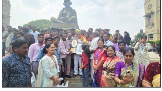
ಮಧುಗಿರಿ ತಾಲೂಕಿನ ಕಾಲೇಜು ವಿದ್ಯಾರ್ಥಿಗಳು ಬೆಂಗಳೂರಿನ ಶಕ್ತಿ ಸೌಧಕ್ಕೆ ಭೇಟಿ ನೀಡಿ, ವಿಧಾನಸೌಧದ ಉಭಯ ಸದನಗಳ ಕಾರ್ಯಕಲಾಪಗಳನ್ನು ಕಣ್ಗಾರಿ ವೀಕ್ಷಿಸುವ ಮೂಲಕ ಪ್ರಜಾಪ್ರಭುತ್ವದ ಸಂಸದೀಯ ವ್ಯವಸ್ಥೆಯ ಬಗ್ಗೆ ಪ್ರಾಯೋಗಿಕ ಜ್ಞಾನ ಪಡೆದರು.