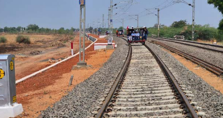
ರೈಲು ಹಳಿಗಳನ್ನು ಸ್ವೀಪರ್‌ಗಳ ಮೇಲೆ 110 ಕಿ.ಮೀ./ಗಂ ವೇಗದಲ್ಲಿ ರೈಲು ಸಂಚಾರಕ್ಕೆ ಸಮರ್ಪಕ ಬ್ಯಾಲಿಸ್ಟ್ ಕುಶಲನೋದಿಗೆ ಅನುಕೂಲವಾಗುವಂತೆ ವಿಸ್ತಾರಗೊಳಿಸಲಾಗಿದೆ. ಅಳವಡಿಸಲಾಗಿದೆ. ಈ ಹಳಿಯನ್ನು ಗರಿಷ್ಠ

ಗದಗ ನೈಋತ್ಯ ರೈಲ್ವೆ ವ್ಯಾಪ್ತಿಯ ಗದಗ-ಹೋಟಗಿ ಡಬ್ಬಿಂಗ್ ಯೋಜನೆಯ ಪ್ರಮುಖ ಹಂತವಾಗಿ ಆಲಮಟ್ಟ-ವಂಡಾಲ್ ನಡವಿಸಿದ 9.60 ಕಿ.ಮೀ. ಬ್ರಾಡ್ ಗೇಜ್ ಡಬ್ಬಿಂಗ್ ಲೈನ್ ಕಾಮಗಾರಿ ಯಶಸ್ವಿಯಾಗಿ ಪೂರ್ಣಗೊಂಡಿದೆ. ಈ ವಿಭಾಗವನ್ನು 25.03.2026ರಂದು ಸಾರ್ವಜನಿಕ ಪ್ರಯಾಣಿಕರ ಸಂಚಾರಕ್ಕೆ ಅಧಿಕೃತವಾಗಿ ತೆರೆದಲಾಗಿದೆ. ಈ ಹೊಸ ರೈಲು ಮಾರ್ಗದಲ್ಲಿ ಪರ್ವತಕ್ಕಿ ಹಳ್ಳದ ಮೇಲೆ ಪ್ರಮುಖ ಓಟದ ವೆಬ್ ಗಡರ್ ಸೇತುವೆ ನಿರ್ಮಾಣಗೊಂಡಿದ್ದು, ಪ್ರತಿ 45.72 ಮೀಟರ್ ಉದ್ದದ 9 ಸ್ಟಾನ್‌ಗಳನ್ನು ಒಳಗೊಂಡಿದೆ. ಜೊತೆಗೆ ಒಂದು ಸಣ್ಣ ಸೇತುವೆ, ಒಂದು ರಸ್ತೆ ಮೇಲ್ವಿಚಾರಣೆ ಹಾಗೂ ಅಗತ್ಯ ಮೂಲಸೌಕರ್ಯಗಳನ್ನು ನಿರ್ಮಿಸಲಾಗಿದೆ. ಮಾರ್ಗದಲ್ಲಿ 60 ಕೆ.ಜಿ. ತೂಕದ