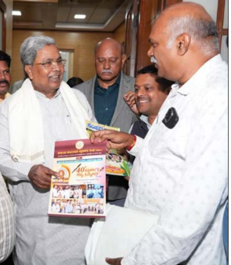
ಕರ್ನಾಟಕ ಕಾರ್ಯನಿರತ ಪತ್ರಕರ್ತರ ಸಂಘವು ನೃತ್ಯ ಏರ್ಪಡಿಸಿ 11:12 ರಂದು ಏರ್ಪಡಿಸಲಾದ 40ನೇ ರಾಜ್ಯ ಪತ್ರಕರ್ತರ ಸಮ್ಮೇಳನಕ್ಕೆ ಸಿದ್ಧಗೊಳ್ಳುತ್ತಿರುವ ಪತ್ರಕರ್ತ ವಿಶೇಷ ಸಂಚಿಕೆ ಸಂದೇಶ, ವಿಶೇಷ ಲೇಖನ ಕೊಡುವಂತೆ ಸಿಎಂ ಸಿದ್ದರಾಮಯ್ಯ ಅವರನ್ನು ಸಂಘದ ರಾಜ್ಯಾಧ್ಯಕ್ಷರಾದ ಶಿವಾನಂದ ತಗಡೂರು ವಿನಂತಿಸಿ ವಿಧಾನಸೌಧದಲ್ಲಿ ಮನವಿ ಸಲ್ಲಿಸಿದರು ಮತ್ತು ಸಮ್ಮೇಳನಕ್ಕೆ ಆಹ್ವಾನಿಸಿದರು.

ಬೆಂಗಳೂರು ಬೆಂಗಳೂರು ಜಲಮಂಡಳಿಯ ವತಿಯಿಂದ ಬೆಂಗಳೂರು ಜಲಮಂಡಳಿ ಅಧ್ಯಕ್ಷರಾದ ಡಾ.ವಿ.ರಾಮ್ ಪ್ರಸಾದ್ ಮನೋಹರ್ ಅಧ್ಯಕ್ಷತೆಯಲ್ಲಿ ಮಾರ್ಚ್ 27 ರಂದು ಶುಕ್ರವಾರ ಬೆಳಿಗ್ಗೆ 09:30 ರಿಂದ 10:30 ರವರೆಗೆ ನೇರ ಪೋನ್-ಇನ್ ಕಾರ್ಯಕ್ರಮ ಆಯೋಜಿಸಲಾಗಿದೆ. ಸಾರ್ವಜನಿಕರು ತಮ್ಮ ವಲಯ/ಪ್ರದೇಶಗಳಲ್ಲಿನ ಕುಡಿಯುವ ನೀರಿನ ಸಮಸ್ಯೆ ಮತ್ತು ಒಳಚರಂಡಿ ಕೊಳವೆ/ಇಳಿ ಗುಂಡಿಯಿಂದ ತ್ಯಾಜ್ಯ ನೀರು ಹೊರಬರುತ್ತಿರುವ ಬಗ್ಗೆ, ಜಲಮಾಪನ ಹಾಗೂ ನೀರಿನ ಬಿಲ್ದಿನ ಸಮಸ್ಯೆಯ ಬಗ್ಗೆ ನೇರವಾಗಿ ಮಾತನಾಡಿ ಕುಂದು-ಕೊರತೆಗಳನ್ನು ಬಗ್ಗಿಸಿಕೊಳ್ಳಬಹುದು. ಸಾರ್ವಜನಿಕರು ಸಂಪರ್ಕಿಸಬಹುದಾದ ದೂರವಾಣಿ ಸಂಖ್ಯೆ: 080-22945119 ಮತ್ತು 080-22229639. ನೀರಿನ ಸಂಪರ್ಕ ಹೊಂದಿರುವ ಗ್ರಾಹಕರು ತಮ್ಮ ಆರ್.ಆರ್.ಸಂಖ್ಯೆಯನ್ನು ತಿಳಿಸಿ ದೂರವಾಣಿ ನಿರೀಕ್ಷಿಸಿ ಕೋರಲಾಗಿದೆ. ಸಾರ್ವಜನಿಕರು ಈ ನೇರ ಪೋನ್-ಇನ್ ಕಾರ್ಯಕ್ರಮದ ಸದುಪಯೋಗಪಡಿಸಿಕೊಳ್ಳಲು ಪ್ರಕಟಣೆಯಲ್ಲಿ ಕೋರಿದೆ.