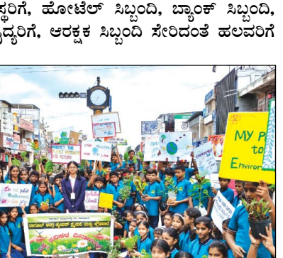
ನಗರದ ತಾಗೂರ್ ವಿದ್ಯಾ ಸಂಸ್ಥೆಯ ಆಂಗ್ಲ ಪ್ರಾಥಮಿಕ ಮತ್ತು ಪ್ರೌಢ ಶಾಲಾ ಮಕ್ಕಳಿಂದ ಪರಿಸರ ದಿನಾಚರಣೆ ಆಂಗವಾಗಿ, ಸಾರ್ವಜನಿಕರಲ್ಲಿ ಜಾಗೃತಿ ಮೂಡಿಸಲು ಪರಿಸರ ಉಳಿಸಿ ಎಂಬ ಅರಿವಿನೊಂದಿಗೆ ಜಾಥಾ ಮತ್ತು ಸಾರ್ವಜನಿಕರಿಗೆ ಸುಮಾರು 150ಕ್ಕೂ ಹೆಚ್ಚು ವಿವಿಧ ತಳಿಯ ಗಿಡಗಳನ್ನು ವಿತರಿಸಲಾಯಿತು.

ಪರಿಸರ ಉಳಿಸಿ ಜಾಥಾ ನಗರದ ತಾಗೂರ್ ವಿದ್ಯಾ ಸಂಸ್ಥೆಯ ಆಂಗ್ಲ ಪ್ರಾಥಮಿಕ ಮತ್ತು ಪ್ರೌಢ ಶಾಲಾ ಮಕ್ಕಳಿಂದ ಪರಿಸರ ದಿನಾಚರಣೆ ಆಂಗವಾಗಿ, ಸಾರ್ವಜನಿಕರಲ್ಲಿ ಜಾಗೃತಿ ಮೂಡಿಸಲು ಪರಿಸರ ಉಳಿಸಿ ಎಂಬ ಅರಿವಿನೊಂದಿಗೆ ಜಾಥಾ ಮತ್ತು ಸಾರ್ವಜನಿಕರಿಗೆ ಸುಮಾರು 150ಕ್ಕೂ ಹೆಚ್ಚು ವಿವಿಧ ತಳಿಯ ಗಿಡಗಳನ್ನು ವಿತರಿಸಲಾಯಿತು.