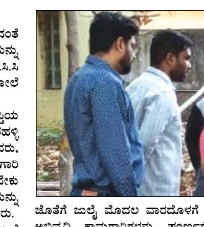
ಜೊತೆಗೆ ಜುಲೈ ಮೊದಲ ವಾರದೊಳಗೆ ಉದ್ಯಾನವನ ಅಭಿವೃದ್ಧಿ ಕಾಮಗಾರಿಗಳನ್ನು ಪೂರ್ಣಗೊಳಿಸುವಂತೆ ನಿರ್ದೇಶನ ನೀಡಿದ್ದರು.

ಬೆಂಗಳೂರು ಹಲಗೆವಡೇರಹಳ್ಳಿ ಕೆರೆಗೆ ಕೊಳಚೆ ನೀರು ಸೇರದಂತೆ ನಿರ್ಮಿಸುತ್ತಿರುವ ತಿರುವು ಗಾಲುವೆ ಕಾಮಗಾರಿಯನ್ನು 15 ದಿನಗಳಲ್ಲಿ ಪೂರ್ಣಗೊಳಿಸುವಂತೆ ಎಫ್.ಇ.ಸಿ.ವಿ.ಶೇಷ ಅಯ್ಯಕ್ಕರಾದ ಸುಪ್ರಸಂಗೋಡಬೋಲೆ ಅವರು ಅಧಿಕಾರಿಗಳಿಗೆ ಸೂಚನೆ ನೀಡಿದರು.