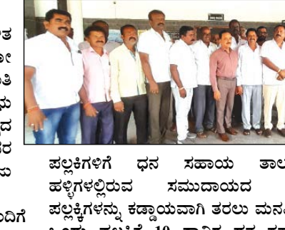
ದೇವಸ್ಥಾನ, ಮಠಗಳು ಅಥವಾ ಧಾರ್ಮಿಕ ಕೇಂದ್ರಗಳಿಗೆ ಹೋಗುವ ಮಾರ್ಗಗಳಲ್ಲಿ ರೈಲ್ವೆ ಗೇಟ್ ಘಂಟೆ ಗಟ್ಟಲೆ ಮುಚ್ಚುವುದರಿಂದ ಭಕ್ತರು ಸಾಕಷ್ಟು ಸಮಯ ಕಾಯಬೇಕಾಗುತ್ತದೆ.