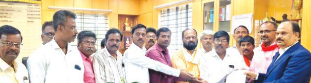
ಅರ್ಹರಿದ್ದರೂ ಮತದಾರರ ಪಟ್ಟಿಯಿಂದ ಕೈ ಬಿಡಲ್ಪಟ್ಟಿದ್ದಾರೆ. ಒತ್ತಾಯ ಪೂರ್ವಕವಾಗಿ ಹೇರಲಾಗಿದ್ದು ಕೂಡಲೇ ಪರಿಶೋಧಿಸಬೇಕು ಎಂದು ಒತ್ತಾಯಿಸಿದರು. ಕರ್ನಾಟಕ ರಾಜ್ಯದಲ್ಲಿ ಚುನಾವಣೆಗೆ ಇನ್ನು ಎರಡು ವರ್ಷ ಇರುವುದರಿಂದ ಎಸ್‌ಐಆರ್ ಮಾಡಲು ಇರುವ ಕಾಲಾವಕಾಶವನ್ನು ವಿಸ್ತರಣೆ ಮಾಡಬೇಕು, ತಾಂತ್ರಿಕ ವ್ಯತ್ಯಾಸ ಲಾಜಿಕೆಗೆ ಡಿಜಿಟಲೈಸಿಯನ್ನು ಕರ್ನಾಟಕದಲ್ಲಿ ಆಳವಡಿಸಿ ತಿರುವ ಎಸ್.ಐ.ಆರ್. ಪ್ರಕ್ರಿಯೆಗಳು ಚುನಾವಣಾ ಆಯೋಗ ಕೇಳುತ್ತಿರುವ ದಾಖಲೆ ಗಳನ್ನು ಒದಗಿಸಲಾಗದೆ ದೊಡ್ಡ ಸಂಖ್ಯೆಯಲ್ಲಿ