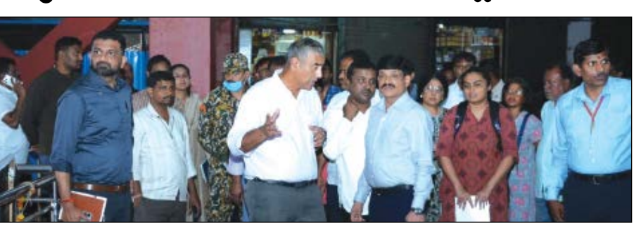
ಮೀಸಲಾದ ಸ್ಥಳಗಳಲ್ಲಿಯೇ ವ್ಯಾಪಾರ ನಡೆಸುವಂತೆ ಕ್ರಮವಹಿಸಬೇಕು. ಈ ಸಂಬಂಧ ಸ್ಥಳಗಳನ್ನು ಗುರುತಿಸಿ, ನಿಗದಿತ ಬಾಗದಲ್ಲಿಯೇ ವ್ಯಾಪಾರ ಮಾಡುವಂತೆ ನೋಡಿಕೊಳ್ಳಬೇಕೆಂದು ಅಧಿಕಾರಿಗಳಿಗೆ ಕಟ್ಟುನಿಟ್ಟಿನ ಸೂಚನೆ ನೀಡಿದರು.