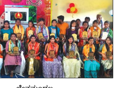
ವಿದ್ಯಾರ್ಥಿಗಳು, ಸಾರ್ವಜನಿಕರ ಜೊತೆ ಸಂವಾದ ನಡೆಸಿ, ನಗರಸಭೆ ವೃತ್ತದಲ್ಲಿ ವಿದ್ಯಾರ್ಥಿಗಳ ಸಾರ್ವಜನಿಕರಲ್ಲಿ ಭಾಷಣದ ಮೂಲಕ ಅರಿವು ಮೂಡಿಸಿದರು.