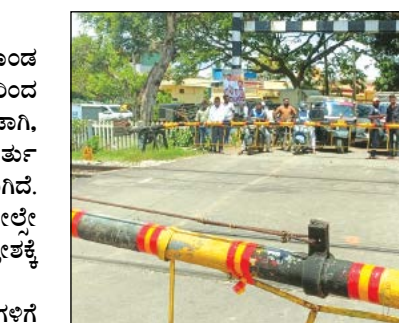
ರೈಲ್ವೆ ಗೇಟ್ ಮುಚ್ಚುವುದರಿಂದ ಸಾರ್ವಜನಿಕರಿಗೆ ನಿತ್ಯವೂ ಸಾಕಷ್ಟು ತೊಂದರೆಯಾಗುತ್ತದೆ.

ತಿರುಮಗೊಂಡಹಳ್ಳಿಯ ರೈಲ್ವೆ ಗೇಟ್ ಬಳಿ ಮೇಲ್ವೇತುವೆ ನಿರ್ಮಾಣಕ್ಕೆ ಆಗ್ರಹ ದೊಡ್ಡಬಲ್ಲಾಪುರ ತಾಲ್ಲೂಕಿನ ತೂಬಗೆರೆ ಹೋಬಳಿ ತಿರುಮಗೊಂಡ ಹಳ್ಳಿಯ ರೈಲ್ವೆ ಗೇಟ್ ಪದೇ ಪದೇ ಮುಚ್ಚುವುದರಿಂದ ಸುಮಾರು ಘಂಟೆಗಳ ಕಾಲ ಸಂಚಾರ ದಟ್ಟಣೆ ಉಂಟಾಗಿ, ವಾಹನ ಸವಾರರು, ಶಾಲಾ ಮಕ್ಕಳು ಹಾಗೂ ತುರ್ತು ಸೇವೆಗಳ ವಾಹನಗಳಿಗೆ ತೀವ್ರ ತೊಂದರೆಯಾಗಿದೆ.