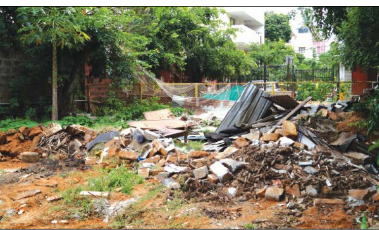
ಈ ಜಾಗವನ್ನು ಕೆಲವು ಅನಾಮಧೇಯ ವ್ಯಕ್ತಿಗಳು ಕಾನೂನುಬಾಹಿರವಾಗಿ ಒತ್ತುವರಿ ಮಾಡಿಕೊಂಡಿರುವುದಾಗಿ ಸಾರ್ವಜನಿಕರಿಂದ ವ್ಯಾಪಕ ದೂರುಗಳು ಕೇಳಿಬಂದಿದ್ದವು.

ಕೆ.ಎಸ್.ಆರ್.ಟಿ.ಸಿ. ಬಡಾವಣೆಯ ಈ ಪ್ರದೇಶವನ್ನು ಸಾರ್ವಜನಿಕ ಉದ್ಯಾನವನಕ್ಕಾಗಿ (ಪಾರ್ಕ್) ಮೀಸಲಿಡಲಾಗಿತ್ತು. ಆದರೆ, ಈ ಜಾಗವನ್ನು ಕೆಲವು ಅನಾಮಧೇಯ ವ್ಯಕ್ತಿಗಳು ಕಾನೂನುಬಾಹಿರವಾಗಿ ಒತ್ತುವರಿ ಮಾಡಿಕೊಂಡಿರುವುದಾಗಿ ಸಾರ್ವಜನಿಕರಿಂದ ವ್ಯಾಪಕ ದೂರುಗಳು ಕೇಳಿಬಂದಿದ್ದವು.