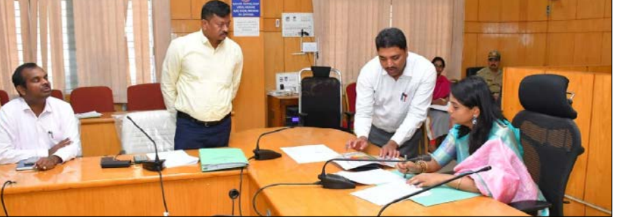
ಜಿಲ್ಲಾಧಿಕಾರಿಗಳ ನಿರ್ದೇಶನದಂತೆ ಸದಸ್ಯ ಕಾರ್ಯದರ್ಶಿಗಳು ಹಾಗೂ ಮಧುಗಿರಿ ಉಪ ವಿಭಾಗಾಧಿಕಾರಿಗಳು ಸಂಬಂಧಿತ ಭೂಮಿಗಳ ಮೌಲ್ಯ ನಿರ್ಣಯ ಮಾಡಿ ಸಮಿತಿಯ ಅನುಮೋದನೆಗಾಗಿ ಸಭೆಗೆ ಮಂಡಿಸಿ ಸಭೆಯಲ್ಲಿ ಯೋಜನೆಗೆ ಅಗತ್ಯವಿರುವ ಭೂಮಿಯನ್ನು ನೇರ ಖರೀದಿ ಮೂಲಕ ಪಡೆಯುವ ಕುರಿತು ಸಮಾಧಾನವಾಗಿ ಚರ್ಚಿಸಲಾಯಿತು. ಯೋಜನೆಗಾಗಿ ಖರೀದಿಸಲಾಗುತ್ತಿರುವ ಭೂಮಿಗೆ ಸಂಬಂಧಿಸಿದಂತೆ ಒಟ್ಟು 13 ಮಂದಿ ಭೂಮಾಲೀಕರು/ಫಲಾನುಭವಿಗಳು ಇದ್ದು, ರೈತರಿಗೆ ನ್ಯಾಯೋಚಿತ ಪರಿಹಾರ ಒದಗಿಸುವ ಉದ್ದೇಶದಿಂದ ಸಮಿತಿಯ ವಿಷಯವನ್ನು ಕೂಲಂಕಿತವಾಗಿ ಪರಿಶೀಲಿಸಿತು. ಬಳಿಕ ನೇರ ಖರೀದಿ ಆಧಾರದ ಮೇಲೆ ಪ್ರತಿ ಎಕರೆಗೆ ರೂ.22 ಲಕ್ಷಗಳ ದರವನ್ನು ನಿಗದಿಪಡಿಸಿ ಅನುಮೋದಿಸಲಾಯಿತು. ಈ ಯೋಜನೆಯ ಅನುಷ್ಠಾನದಿಂದ ಪ್ರದೇಶದಲ್ಲಿ ವಿದ್ಯುತ್ ಮೂಲಸೌಕರ್ಯ ಮತ್ತಷ್ಟು ಬಲಗೊಳ್ಳಲಿದ್ದು, ವಿದ್ಯುತ್ ಸರಬರಾಜಿನ ಗುಣಮಟ್ಟ ಹಾಗೂ ವಿಶ್ವಾಸಾರ್ಹತೆ ಹೆಚ್ಚಳವಾಗಲಿದೆ ಎಂದು ಸಭೆಯಲ್ಲಿ ತಿಳಿಸಲಾಯಿತು. ಸಭೆಯಲ್ಲಿ ಮಾನ್ಯ ಜಿಲ್ಲಾಧಿಕಾರಿಗಳು, ಕೆಪಿಟಿಸಿಎಲ್ ನಿರ್ದೇಶಕರು ಮತ್ತು ಜಿಲ್ಲಾ ಮಟ್ಟದ ಅಧಿಕಾರಿಗಳು ಭಾಗವಹಿಸಿದ್ದರು.

ತುಮಕೂರು ಜಿಲ್ಲೆ ಪಾವಗಡ ತಾಲೂಕಿನ ನಾಗಲಮಡಿಕೆ ಹೋಬಳಿಯ ಹುಸೇನ್‌ಪುರ ಗ್ರಾಮದಲ್ಲಿ 400/220 ಕೆ.ವಿ. ವಿದ್ಯುತ್ ಸ್ಥಾವರ ನಿರ್ಮಾಣ ಯೋಜನೆಗೆ ಅಗತ್ಯವಿರುವ ಭೂಮಿಯನ್ನು ನೇರ ಖರೀದಿ ಮೂಲಕ ಸ್ವಾಧೀನಪಡಿಸಿಕೊಳ್ಳುವ ಸಂದರ್ಭ ಧರ ನಿರ್ಧರಣಾ ಸಲಹಾ ಸಮಿತಿಯ ಸಭೆಯು ಇಂದು ಮಾನ್ಯ ಜಿಲ್ಲಾಧಿಕಾರಿಗಳು ಹಾಗೂ ಧರ ನಿರ್ಧರಣಾ ಸಲಹಾ ಸಮಿತಿಯ ಅಧ್ಯಕ್ಷರ ಅಧ್ಯಕ್ಷತೆಯಲ್ಲಿ ನಡೆಯಿತು. ಭೂಸ್ವಾಧೀನ ಪ್ರಕ್ರಿಯೆಯಲ್ಲಿ ಪಾರದರ್ಶಕ ಮತ್ತು ನ್ಯಾಯೋಚಿತ ಪರಿಹಾರದ ಹಕ್ಕು, ಪುನರ್ವಸತಿ ಮತ್ತು ಪುನರಾವೇಶ ಹಕ್ಕು ಅಧಿನಿಯಮ-2013ರ ಕಲಂ 46ರ ಅನ್ವಯ, ಯೋಜನೆಗೆ ಅಗತ್ಯವಿರುವ ಭೂಮಿಯನ್ನು ಭೂಮಾಲೀಕರಿಂದ ನೇರವಾಗಿ ಖರೀದಿಸುವ ಕುರಿತು ಸಭೆಯಲ್ಲಿ ಚರ್ಚಿಸಲಾಯಿತು. ಸರ್ಕಾರದ ಮಾರ್ಗಸೂಚಿಯಂತೆ 100 ಎಕರೆ ವಿಸ್ತೀರ್ಣ ಮೀರಿದ ಭೂಮಿಯನ್ನು ನೇರ ಖರೀದಿ ಮೂಲಕ ಪಡೆಯಲು ಅವಕಾಶವಿದ್ದು, ಈ ಸಂದರ್ಭ ಭೂಕೋಶಕ್ಕೆ ಇಲಾಖೆಯಾದ ಕರ್ನಾಟಕ ವಿದ್ಯುತ್ ಪ್ರಸಾರ ನಿಗಮ ನಿಯಮಿತ (ಕೆಪಿಟಿಸಿಎಲ್), ತುಮಕೂರು ವತಿಯಿಂದ ಸಲ್ಲಿಸಲಾದ ಪ್ರಸ್ತಾವನೆಯ ಮೇರೆಗೆ ಕ್ರಮ ಕೈಗೊಳ್ಳಲಾಗುತ್ತದೆ.