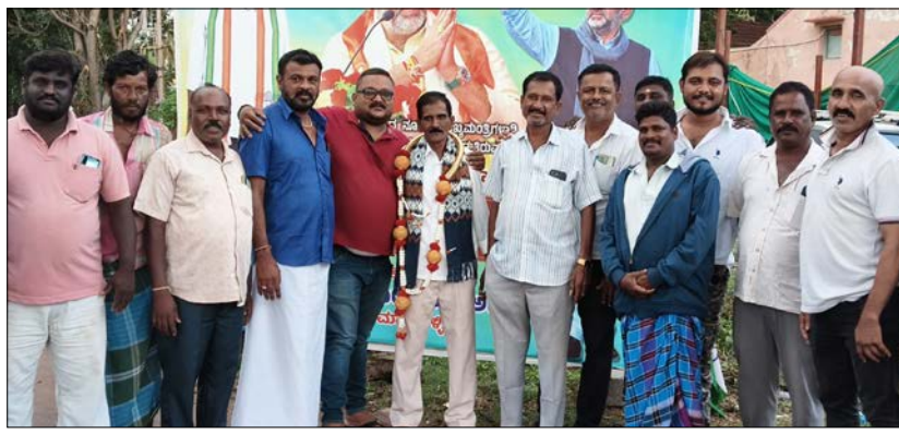
ಜನರ ತನಕ ಎಲ್ಲರಿಗೂ ನ್ಯಾಯ ಒದಗಿಸುವ ನಾಯಕತ್ವವನ್ನು ಡಿ.ಕೆ. ಶಿವಕುಮಾರ್ ಅವರು ನೀಡಲಿದ್ದಾರೆ ಎಂಬ ವಿಶ್ವಾಸ ವ್ಯಕ್ತಪಡಿಸಿದರು. ತಾಳ್ಮೆ, ದೃಢ ಸಂಕಲ್ಪ ಮತ್ತು ನಿರಂತರ ಪರಿಶ್ರಮದಿಂದ ಅವರು ಮುಖ್ಯಮಂತ್ರಿ ಹುದ್ದೆ