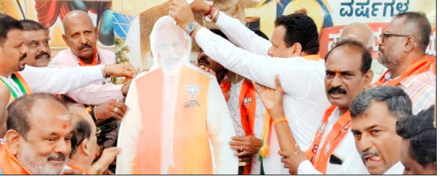
ಅಭ್ಯಂತರ ಇಲ್ಲ ಎಂದರು. ಮುಂದಿನ ದಿನಗಳಲ್ಲಿ ನಮ್ಮ ಬಿಜೆಪಿ ಸರ್ಕಾರ ಅಧಿಕಾರಕ್ಕೆ ಬರುವುದು ಖಚಿತ ಎಲ್ಲ ನಾಯಕರು ಒಗ್ಗೂಡಿ ಕೃಷ್ಣಾ ನದಿ ನೀರನ್ನು ಈ ಭಾಗಕ್ಕೆ ಹರಿಸಿ ಕೃಷಿಕರಿಗೆ ಅನುಕೂಲ ಮಾಡಿಕೊಡುವುದು ತಶತಸ್ಥಿ ಎಂದರು. ನಮ್ಮ ನೆರೆಯ ಅಂಧದ ಗಡಿಯಲ್ಲಿ ಕೃಷ್ಣಾ ನದಿ ನೀರು ಹರಿಯುತ್ತಿದ್ದು ಕೃಷ್ಣಾ ನದಿ ನೀರನ್ನು ಕೋಲಾರ ಹಾಗೂ ಚಿಕ್ಕಬಳ್ಳಾಪುರ ಜಿಲ್ಲೆಯ ಕೃಷಿಗೆ ಹರಿಸಬೇಕೆಂದೆ ಆದರೆ ರಾಜ್ಯ ಸರ್ಕಾರಕ್ಕೆ