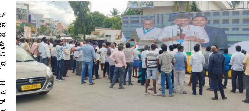
ಕಳೆದ ಎರಡು ದಿನಗಳಿಂದ ನಗರ ಸೇರಿದಂತೆ ವಿವಿಧ ಬಡಾವಣೆಗಳಲ್ಲಿ ಡಿಕೆಶಿಗೆ ಶುಭಾಶೀರ್ವಚನ ಬ್ಯಾನರ್ ಗಳು ಹಾಗೂ ಫ್ಲೆಕ್ಸ್ ಗಳು ಉರಾಜಿಸುತ್ತಿದ್ದವು. ಮುಖ್ಯಮಂತ್ರಿ ವೀಕ್ಷಿಸಲು ನಗರದ ಚಿನ್ನಬಸವ್ವ ವೃತ್ತದಲ್ಲಿ ಬೃಹತ್ ಸಂದಗ್ರಹಣೆ ನಡೆಯಿತು.

ಕನಕಪುರ ತಾಲ್ಲೂಕಿನ ಹೆಮ್ಮೆಯ ನಾಯಕ ಡಿ.ಕೆ. ಶಿವಕುಮಾರ್ ಅವರು ರಾಜ್ಯದ ಮುಖ್ಯಮಂತ್ರಿಯಾಗಿ ಪ್ರಮಾಣವಚನ ಸ್ವೀಕರಿಸಿದ ಹಿನ್ನೆಲೆಯಲ್ಲಿ ಕನಕಪುರ ತಾಲ್ಲೂಕಿನಾದ್ಯಂತ ಸಂಭ್ರಮದ ವಾತಾವರಣ ನಿರ್ಮಾಣವಾಗಿದೆ. ಕಾಂಗ್ರೆಸ್ ಕಾರ್ಯಕರ್ತರು, ಮುಖಂಡರು ಹಾಗೂ ಸಾರ್ವಜನಿಕರು ಈ ಐತಿಹಾಸಿಕ ಕ್ಷಣವನ್ನು ಹಬ್ಬದ ರೀತಿಯಲ್ಲಿ ಆಚರಿಸಿದರು.