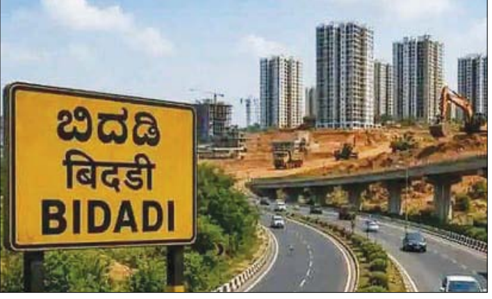
ಪರಿಹಾರ ದರ ನಿಗದಿಪಡಿಸಲಾಗಿದೆ. ಸರ್ಕಾರದ ಈ ಕ್ರಮ ರಾಜ್ಯ ರಾಜಕೀಯ ಹಾಗೂ ರೈತರ ವಲಯದಲ್ಲಿ ಭಾರೀ ಚರ್ಚೆಗೆ ಕಾರಣವಾಗಿದೆ. ಕಳೆದ ಒಂದೂವರೆ ವರ್ಷಗಳಿಂದ ವಿರೋಧ ವ್ಯಕ್ತಪಡಿಸುತ್ತಿರುವ ರೈತರು ನಿರಂತರ ಹೋರಾಟ ನಡೆಸುತ್ತಿದ್ದು, ಕೃಷಿ ಭೂಮಿ ಕಳೆದುಕೊಳ್ಳುವ ಆತಂಕ ವ್ಯಕ್ತಪಡಿಸಿದ್ದಾರೆ.

ರಾಮನಗರ: ಬಹುಚರ್ಚಿತ ಬಿಡದಿ ಚೌನಿಶಿವ್ ಯೋಜನೆಗೆ ಸಂಬಂಧಿಸಿದಂತೆ ರೈತರ ತೀವ್ರ ವಿರೋಧದ ನಡುವೆಯೂ ರಾಜ್ಯ ಸರ್ಕಾರ ಮಹತ್ವದ ಹೆಜ್ಜೆ ಇಟ್ಟಿದ್ದು, ಭೂಸ್ವಾಧೀನಕ್ಕೆ ಸಂಬಂಧಿಸಿದ ಅಂತಿಮ ಅಧಿಸೂಚನೆಯನ್ನು ಪ್ರಕಟಿಸಿದೆ. ಯೋಜನಾ ವ್ಯಾಪ್ತಿಯ ಒಟ್ಟು 9 ಕಂದಾಯ ಗ್ರಾಮಗಳ ಪೈಕಿ ಪ್ರಾರಂಭಿಕ ಹಂತದಲ್ಲಿ ಮೂರು ಗ್ರಾಮಗಳ ಸುಮಾರು 518 ಎಕರೆ ಭೂಸ್ವಾಧೀನ ಪ್ರಕ್ರಿಯೆಗೆ ಸರ್ಕಾರ ಅಧಿಕೃತ ಘಾಟನೆ ನೀಡಿದೆ. ಬಿಡದಿ ಹೋಬಳಿಯ ಕೆಂಪಯ್ಯನಪಾಳ್ಯ, ಮಂಡಲಹಳ್ಳಿ ಹಾಗೂ ವಡೇರಹಳ್ಳಿ ಗ್ರಾಮಗಳ ಸುಮಾರು 754 ರೈತರ ಜಮೀನುಗಳನ್ನು ಭೂಸ್ವಾಧೀನಕ್ಕೆ ಒಳಪಡಿಸಲಾಗುತ್ತಿದೆ.