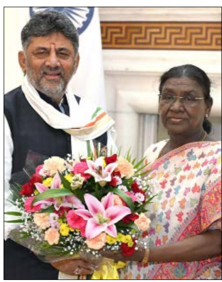
ನವದೆಹಲಿ: ಸಿಎಂ ಡಿ.ಕೆ.ಶಿವಕುಮಾರ್ ಅವರು ಇಂದು ಶುಭವಾರ ರಾಷ್ಟ್ರಪತಿ ದೌರಾತ್ ಮುರ್ಮು ಅವರನ್ನು ಭೇಟಿ ಆಗಿ ರಾಜ್ಯದ ಅಭಿವೃದ್ಧಿ ಬಗ್ಗೆ ಚರ್ಚೆ ನಡೆಸಿದರು.