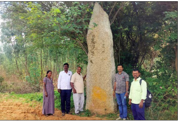
ನೆಲಕೋಣೆ ಹಾಗೂ ನಿಲಸುಗಲ್ಲು ಮಾದರಿಯ ಸಮಾಧಿ ರಚನೆಗಳು ಕಂಡುಬಂದಿವೆ. ಸುಮಾರು 30 ಅಡಿ ಉದ್ದ ಮತ್ತು 15 ಅಡಿ ಅಗಲದ ಕಲ್ಲುವಸ್ತು ಸಮಾಧಿಗಳನ್ನು 15ಕ್ಕೂ ಹೆಚ್ಚು ಎರಡು ಬೃಹತ್ ನಿಲಸುಗಲ್ಲುಗಳನ್ನು ನಿರ್ಮಿಸಲಾಗಿದೆ. ಸಮಾಧಿಗಳ ಮುಚ್ಚಳ ಕಲ್ಲುಗಳು ಸುಮಾರು 7 ಅಡಿ ಅಗಲ ಮತ್ತು 2 ಅಡಿ ಎತ್ತರ ಹೊಂದಿರುವುದು ಗಮನಾರ್ಹವಾಗಿದೆ. ಈ ನೆಲೆಯ ಅತ್ಯಂತ ವಿಶೇಷ ಅಂಶವೆಂದರೆ, ಒಂದೇ ಕಲ್ಲುವಸ್ತುಗಳಿಗೆ ಎರಡು ಬೃಹತ್ ನಿಲಸುಗಲ್ಲುಗಳನ್ನು ಪತ್ತೆಯಾಗಿರುವುದು. ಅವುಗಳಲ್ಲಿ ಒಂದು