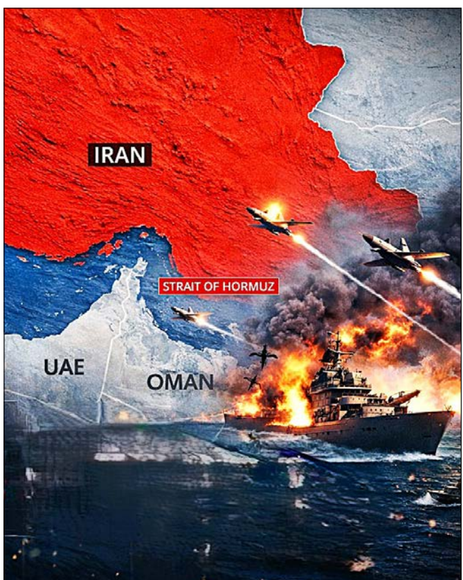
ಅಧಿಕೃತವಾಗಿ ದೃಢಪಡಿಸಿದ್ದಾರೆ. ಮಹತ್ವದ ಶಾಂತಿ ಒಪ್ಪಂದದ ಫೈನಲ್ ಡೀಲ್ ಹಿಂದೆ ಸಚಿವರು ಗುಡುಗಿದ್ದಾರೆ.

ವಾಷಿಂಗ್ಟನ್/ಟೆಹರಾನ್: ಕಳೆದ 106 ದಿನಗಳಿಂದ ಇಡೀ ಜಗತ್ತನ್ನೇ ಮೂರನೇ ಮಹಾಯುದ್ಧದ ಭೀತಿಯಲ್ಲಿಟ್ಟಿದ್ದ ಇರಾನ್-ಅಮೆರಿಕ-ಇಸ್ರೇಲ್ ನಡುವಿನ ಭೀಕರ ಸಂಘರ್ಷ ಕೊನೆಗೂ ಅಂತ್ಯವಾಗುವ ಕಾಲ ಸನ್ನಿಹಿತವಾಗಿದೆ. ಇರಾನ್ ಜೊತೆಗಿನ ಬದುಕಿರಲಿಕ್ಕಿಲ್ಲದಂತೆ ಒಪ್ಪಂದವನ್ನು ಅಂತಿಮಗೊಳಿಸುವುದಾಗಿ ಅಮೆರಿಕ ಅಧ್ಯಕ್ಷ ಡೋನಾಲ್ಡ್ ಟ್ರಾಂಪ್ ಅಧಿಕೃತವಾಗಿ ಪ್ರಕಟಿಸಿದ್ದಾರೆ. ತಮ್ಮ ಟ್ರಾಕ್ ಸೋಲಿಯಲ್ ಖಾತೆಯಲ್ಲಿ ಪೋಸ್ಟ್ ಮಾಡಿರುವ ಟ್ರಾಂಪ್ ಬರುವ ಜೂನ್ 19 ರಂದು ಸ್ಟ್ರಿಟ್‌ಲೈಟ್‌ನ ಜಿನಿವಾದಲ್ಲಿ ಉಭಯ ದೇಶಗಳು 14 ಅಂಶಗಳ ಐತಿಹಾಸಿಕ ಶಾಂತಿ ಒಪ್ಪಂದಕ್ಕೆ ಔಪಚಾರಿಕವಾಗಿ ಸಹಿ ಹಾಕಲಿವೆ ಎಂದು ತಿಳಿಸಿದ್ದಾರೆ. ಈ ಒಪ್ಪಂದವು ಹೊರಮುಖ ಜಲಸಂಧಿಯನ್ನು ಮತ್ತೆ ತೆರೆದು ಮತ್ತು ಇರಾನ್ ಬಂದರುಗಳ ಮೇಲಿನ ಅಮೆರಿಕ ನೌಕಾ ದಿಗ್ವಿಧಾನವನ್ನು ಕೊನೆಗೊಳಿಸಲು ನೆರವಾಗಲಿದೆ. ಖಿಫ್‌ದ ಹಡಗುಗಳೇ, ನಿಮ್ಮ ಎಂಜಿನ್‌ಗಳನ್ನು ಸ್ವಾರ್ಥಿ ಮಾಡಿ, ತೈಲ ಹರಿಯಲು ಬಿಡಿ. ಎಲ್ಲರಿಗೂ ಅಭಿನಂದನೆಗಳು ಎಂದು ಟ್ರಾಂಪ್ ಬರೆದುಕೊಂಡಿದ್ದಾರೆ. ಒಪ್ಪಂದಕ್ಕೆ ಸಹಿ ಬಿದ್ದ ಬೆನ್ನಲ್ಲೇ ಜಾಗತಿಕ ತೈಲ ಸಂಚಾರಕ್ಕೆ ಪ್ರಮುಖವಾಗಿರುವ ಹೊರಮುಖ ಜಲಸಂಧಿಯನ್ನು ಮುಕ್ತಗೊಳಿಸಲಾಗುವುದು ಎಂದು ಅವರು ಸ್ಪಷ್ಟಪಡಿಸಿದ್ದಾರೆ. ಅಮೆರಿಕದ ಬೆನ್ನಲ್ಲೇ ಇರಾನ್‌ನ ಉಪ ವಿಧೇಶಾಂಗ ಸಚಿವ ಕಜೆಮ್ ಫಾರಿಬಾದಿ ಕೂಡ ಈ ಒಪ್ಪಂದವನ್ನು