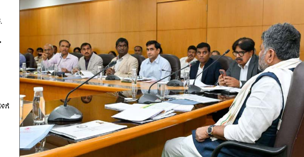
ತಂತ್ರಜ್ಞಾನವನ್ನು ರೈತರಿಗೆ ತಲುಪಿಸುವ ವ್ಯವಸ್ಥೆ ಕಲ್ಪಿಸಬೇಕು. ಪ್ರಕೃತಿ ವೈಪರೀತ್ಯಗಳಿಂದ ರೈತರ ಕೃಷಿ ಚಟುವಟಿಕೆಗಳಿಗೆ ತೊಂದರೆ ಆಗದಂತೆ ಮುನ್ನೆಚ್ಚರಿಕಾ ಕ್ರಮ ಕೈಗೊಳ್ಳಬೇಕು ಎಂದರು. ತಾಲ್ಲೂಕು ಹಾಗೂ ಹೋಬಳಿ ಮಟ್ಟದಲ್ಲಿ ಖಾಲಿ ಇರುವ ಹುದ್ದೆಗಳನ್ನು ತೀವ್ರ ಭರ್ತಿ ಮಾಡುವಂತೆ ಸೂಚಿಸಿದ ಸಿಎಂ, ಪ್ರಾಥಮಿಕ ಕೃಷಿಯ ಜೊತೆಗೆ ಪೂರಕ ಕೃಷಿ ಚಟುವಟಿಕೆಗಳ ಮೂಲಕ ರೈತರ ಆದಾಯ ಹೆಚ್ಚಿಸುವ ಯೋಜನೆಗಳನ್ನು ಪರಿಣಾಮಕಾರಿಯಾಗಿ ಜಾರಿಗೊಳಿಸಲು ತಿಳಿಸಿದರು.

ಬೆಂಗಳೂರು: ರೈತರಿಗೆ ಬಿತ್ತನೆ ಬೀಜ ಹಾಗೂ ರಸಗೊಬ್ಬರ ಸಮರ್ಪಕವಾಗಿ ಪೂರೈಕೆ ಆಗುವಂತೆ ಅಗತ್ಯ ಕ್ರಮ ಕೈಗೊಳ್ಳಬೇಕು ಎಂದು ಮುಖ್ಯಮಂತ್ರಿ ಡಿ.ಕೆ. ಶಿವಕುಮಾರ್ ಅಧಿಕಾರಿಗಳಿಗೆ ಸೂಚನೆ ನೀಡಿದರು. ವಿಧಾನಸೌಧದಲ್ಲಿ ಸೋಮವಾರ ಕೃಷಿ, ತೋಟಗಾರಿಕೆ, ರೇಷ್ಮೆ ಹಾಗೂ ಮೀನುಗಾರಿಕೆ ಇಲಾಖೆಗಳ ಪ್ರಗತಿ ಪರಿಶೀಲನಾ ಸಭೆ ನಡೆಸಿದ ಅವರು, ಬರ ಪರಿಸ್ಥಿತಿ ಎದುರಿಸಲು ಅಗತ್ಯ ಪೂರೈಕೆಗಳನ್ನು ತಲುಪಿಸುವುದರ ಜೊತೆಗೆ ಅತಿವೃಷ್ಟಿ ಹಾಗೂ ಅನಾವೃಷ್ಟಿ ಪರಿಸ್ಥಿತಿಯನ್ನು ಸಮರ್ಪಕವಾಗಿ ಎದುರಿಸಲು ಸಿದ್ಧರಾಗುವಂತೆ ಅಧಿಕಾರಿಗಳಿಗೆ ಸೂಚಿಸಿದರು. ಕ್ರಿಮಿನಾಶಕ ಮತ್ತು ಇತರ ಔಷಧ ಸಂಪದಕ್ಕೆ ಸಲಕರಣೆಗಳನ್ನು ರೈತರಿಗೆ ಒದಗಿಸುವ ವ್ಯವಸ್ಥೆ ಮಾಡಬೇಕು. ಕೃಷಿ ಹೊಂಡಗಳಿಗೆ ಬಿತ್ತನೆ ಸಾಧನಗಳನ್ನು ಘಟನೆಗಳು ಹೆಚ್ಚುತ್ತಿರುವ ಹಿನ್ನೆಲೆಯಲ್ಲಿ ಹೊಂಡಗಳಿಗೆ ಬೇಲಿ ನಿರ್ಮಿಸಲು ಯೋಜನೆ ರೂಪಿಸಬೇಕು ಎಂದು ಸೂಚಿಸಿದರು. ಇತರ ರಾಜ್ಯಗಳ ಮಾದರಿ ಯೋಜನೆಗಳನ್ನು ಅಧ್ಯಯನ ಮಾಡಿ, ರಾಜ್ಯದ ಕೃಷಿ ಪದ್ಧತಿ ಹಾಗೂ ಬೆಳೆ ಮಾದರಿಗೆ ಅನುಗುಣವಾಗಿ ಜಾರಿಗೊಳಿಸುವಂತೆ ಸಲಹೆ ನೀಡಿದರು. ದ್ರೋಣ್, ಕೃತಕ ಬುದ್ಧಿಮತ್ತೆ ಸೇರಿದಂತೆ ಆಧುನಿಕ