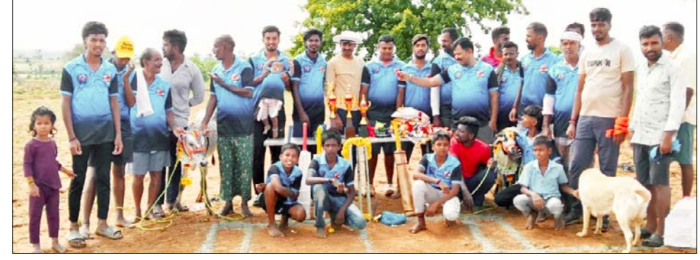
ಗ್ರಾಮೀಣ ಪ್ರದರ್ಶನದಲ್ಲಿ ಕ್ರೀಡಾ ಚಟುವಟಿಕೆಗಳಿಗೆ ಹೆಚ್ಚಿನ ಉತ್ತೇಜನ ನೀಡುವ ಅಗತ್ಯವಿದೆ ಎಂದು ಹೇಳಿದರು. ಯುವಕರು ಕ್ರೀಡೆಯ ಮೂಲಕ ತಮ್ಮ ಪ್ರತಿಭೆಯನ್ನು ಅನಾವರಣಗೊಳಿಸುವುದರ ಜೊತೆಗೆ ಉತ್ತಮ ವ್ಯಕ್ತಿತ್ವವನ್ನು ರೂಪಿಸಿಕೊಳ್ಳಬೇಕು. ಕ್ರಿಕೆಟ್ ಸೇರಿದಂತೆ ವಿವಿಧ ಕ್ರೀಡೆಗಳು ಶಿಷ್ಯ, ಏಕಾಗ್ರತೆ, ಆತ್ಮವಿಶ್ವಾಸ ಹಾಗೂ ತಂಡದ ಮನೋಭಾವವನ್ನು ಬೆಳೆಸುವಲ್ಲಿ ಪ್ರಮುಖ ಪಾತ್ರ ವಹಿಸುತ್ತವೆ ಎಂದು ತಿಳಿಸಿದರು. ಗ್ರಾಮೀಣ ಮಟ್ಟದಲ್ಲಿ ಇಂತಹ ಕ್ರೀಡಾಕೂಟಗಳನ್ನು ಆಯೋಜಿಸುವುದರಿಂದ ಪ್ರತಿಭಾವಂತ ಆಟಗಾರರನ್ನು ಗುರುತಿಸಿ ಅವರಿಗೆ ರಾಜ್ಯ ಹಾಗೂ ರಾಷ್ಟ್ರಮಟ್ಟದ