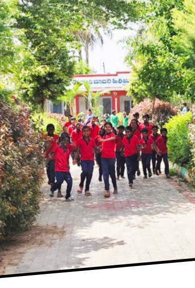
ಇದ್ದಾರೆ. ಖಾಸಗಿ ಶಾಲೆಗಳು ಸಮೀಪದಲ್ಲಿದ್ದರೂ ಹೆಚ್ಚಿನ ಸಂಖ್ಯೆಯಲ್ಲಿ ಪ್ರೋತ್ಸಾಹಕ ತಮ್ಮ ಮಕ್ಕಳನ್ನು ಈ ಸರ್ಕಾರಿ ಶಾಲೆಗೆ ದಾಖಲಿಸುತ್ತಿರುವುದು ವಿಶೇಷವಾಗಿದೆ.

ಶಾಲೆಯಲ್ಲಿ ಮಕ್ಕಳಿಗೆ ಅಗತ್ಯವಾದ ಬೆಂಚುಗಳು, ಕುರ್ಚಿಗಳು, ಪುಸ್ತಕ ಕುಡಿಯುವ ನೀರಿನ ವ್ಯವಸ್ಥೆ, ಪ್ರತ್ಯೇಕ ಶೌಚಾಲಯಗಳು, ಅನ್ನದಾನೋಹ ಕೊಠಡಿ ಹಾಗೂ ವಿಶಾಲ ಆಟದ ಮೈದಾನವಿದೆ. ಕ್ರೀಡೆ, ವಾಲಿಬಾಲ್, ಫೋಟೋ, ಥೋಟೋ ಸೇರಿದಂತೆ ವಿವಿಧ ಕ್ರೀಡೆಗಳ ಜೊತೆಗೆ ಯೋಗ, ಪ್ರಾಣಾಯಾಮ ಹಾಗೂ ಸಾಂಸ್ಕೃತಿಕ ಚಟುವಟಿಕೆಗಳಿಗೂ ಆದ್ಯತೆ ನೀಡಲಾಗಿದೆ. ವಿದ್ಯಾಚೇತನ ಹಾಗೂ ವರ್ಗಾಂತರ ಹಂತದ ವಿದ್ಯಾರ್ಥಿಗಳಿಗೆ ಆಟದ ಮೂಲಕ ಕಲಿಕೆ, ವಿಷಯವಾರು ಚಟುವಟಿಕೆಗಳು ಹಾಗೂ ದ್ವಿಭಾಷಾ ದೋಷನೆಯ ಮೂಲಕ ಕಲಿಕೆಯನ್ನು ಆಸಕ್ತಿದಾಯಕಗೊಳಿಸಲಾಗಿದೆ. “ಮಕ್ಕಳಿಗೆ ಗುಣಮಟ್ಟದ ಶಿಕ್ಷಣದ ಜೊತೆಗೆ ಶಿಸ್ತು ಮತ್ತು ಮೌಲ್ಯಧಾರಿತ ಶಿಕ್ಷಣ ನೀಡುವ ಗುರಿಯೊಂದಿಗೆ ಶಾಲೆಯನ್ನು ಅಭಿವೃದ್ಧಿಪಡಿಸಲಾಗುತ್ತಿದೆ. ಈ ಕಾರ್ಯಕ್ಕೆ ಪ್ರೋತ್ಸಾಹಕ, ಎಸ್‌ಡಿಎಂ ಸದಸ್ಯರು ಹಾಗೂ ಗ್ರಾಮಸ್ಥರ ಉತ್ತಮ ಸಹಕಾರ ದೊರೆಯುತ್ತಿದೆ” ಎಂದು ವಿಶೇಷವಾಗಿದೆ.