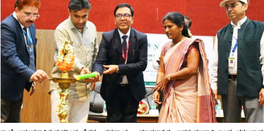
ಶಾಖೆ ಆರಂಭವಾಗಿರುವುದರಿಂದ ರೈತರು, ಸ್ವಸಹಾಯ ಸಂಘಗಳು ಹಾಗೂ ಗ್ರಾಮೀಣ ಉದ್ಯಮಿಗಳಿಗೆ ಹೆಚ್ಚಿನ ಅನುಕೂಲವಾಗಲಿದೆ ಎಂದು ತಿಳಿಸಿದರು.