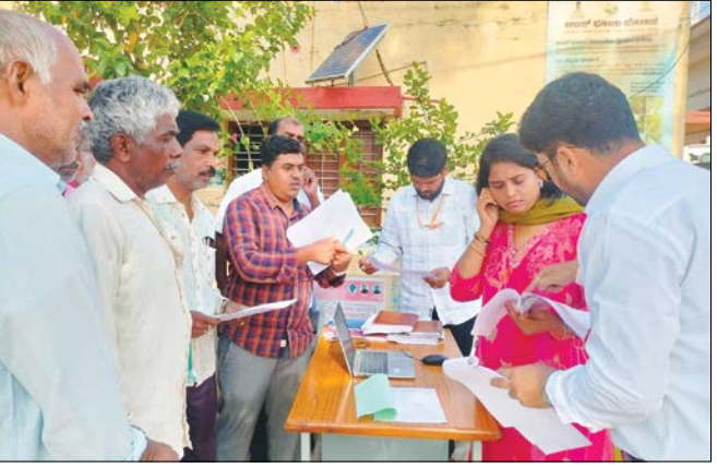
ಕಂದಾಯ ಸೌಲಭ್ಯಗಳ ಕುರಿತು ಚರ್ಚಿಸಿದ ಕಚೇರಿಯಲ್ಲಿ ಆರ್.ಆರ್.ಟಿ ಅರ್ಜಿಗಳ ಸಂದರ್ಭದಲ್ಲಿ, ಉಪವಿಭಾಗಾಧಿಕಾರಿಗಳ ವಿಲೇವಾರಿಯಲ್ಲಿ ವಿಳಂಬವಾಗುತ್ತಿರುವ ಬಗ್ಗೆ