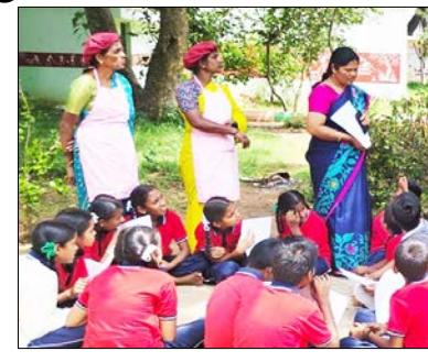
ಏಳನೇ ತರಗತಿಯಲ್ಲಿ ಒಟ್ಟು 59 ವಿದ್ಯಾರ್ಥಿಗಳು ದಾಖಲಾಗಿದ್ದು, ಅವರಲ್ಲಿ 33 ಗಂಡು ಹಾಗೂ 26 ಹೆಣ್ಣು ಮಕ್ಕಳು

ಚಿಕ್ಕಬಳ್ಳಾಪುರ ಸರ್ಕಾರಿ ಶಾಲೆಗಳ ಬಗ್ಗೆ ಜನರಲ್ಲಿರುವ ಸಾಂಪ್ರದಾಯಿಕ ಕಲ್ಪನೆಗಳನ್ನು ಬದಲಾಯಿಸುತ್ತಿರುವ ಚಿಕ್ಕಬಳ್ಳಾಪುರ ತಾಲೂಕಿನ ನಾಯನಹಳ್ಳಿ ಸರ್ಕಾರಿ ಹಿರಿಯ ಪ್ರಾಥಮಿಕ ಶಾಲೆ, ಗುಣಮಟ್ಟದ ಶಿಕ್ಷಣ ಹಾಗೂ ಆಕರ್ಷಕ ಪರಿಸರದ ಮೂಲಕ ಮಕ್ಕಳನ್ನು ಕೈಬಿಡಿಸಿ ಕರೆಯುತ್ತಿದೆ. ಚಿಕ್ಕಬಳ್ಳಾಪುರ-ಶಿಕ್ಷಣಾಭಿವೃದ್ಧಿ ಯೋಜನೆಯ ಹೆದ್ದಾರಿ ಮಾರ್ಗದಲ್ಲಿರುವ ಈ ಶಾಲೆ ಇಂದು ಸಕಲ ಸೌಲಭ್ಯಗಳನ್ನು ಒಳಗೊಂಡ ಮಾದರಿ ಶಾಲೆಯಾಗಿ ಹೊರಹೊಮ್ಮಿದೆ. ಶಿಕ್ಷಕರ ಅವಿರತ ಶ್ರಮ, ಎಸ್‌ಡಿಎಂ ಸದಸ್ಯರು, ಗ್ರಾಮಸ್ಥರು ಹಾಗೂ ಹಳೆಯ ವಿದ್ಯಾರ್ಥಿಗಳ ಸಹಕಾರದಿಂದ ಶಾಲೆಯ ಆವರಣವು ಹಸಿರಿನ ಉದ್ಯಾನವನದಂತಾಗಿದೆ. ಶಾಲೆಯ ಒಳಾಂಗಣ ಹಾಗೂ ಹೊರಾಂಗಣದಲ್ಲಿ ಕನ್ನಡ ಅಕ್ಷರಮಾಲೆ, ಅಂಕಿಗಳು, ಕಾಗುಣಿತಗಳು, ಬಣ್ಣ ಬಣ್ಣದ ಚಿತ್ರಕಲೆಗಳು ಮತ್ತು ಕಲಾಕೃತಿಗಳನ್ನು ಅಳವಡಿಸಲಾಗಿದ್ದು, ಮಕ್ಕಳ ಕಲಿಕೆಗೆ ಪ್ರೋತ್ಸಾಹ ವಾತಾವರಣ ನಿರ್ಮಿಸಲಾಗಿದೆ. ಹಸಿರಿನಿಂದ ಕಂಗೊಳಿಸುವ ಶಾಲಾ ಆವರಣ ವಿದ್ಯಾರ್ಥಿಗಳಿಗೆ ವಿಶೇಷ ಆಕರ್ಷಣೆಯಾಗಿದೆ. ಶಾಲೆಯಲ್ಲಿ ದ್ವಿಭಾಷಾ (ಕನ್ನಡ- ಇಂಗ್ಲಿಷ್) ಶಿಕ್ಷಣದ ಜೊತೆಗೆ ಗಣಕಯಂತ್ರ ಶಿಕ್ಷಣವನ್ನೂ ನೀಡಲಾಗುತ್ತಿದೆ. ಪ್ಯಾನ್ಸ್ ಫಲಕಗಳ ಮೂಲಕ ಆಧುನಿಕ ಶಿಕ್ಷಣ ಕಲಿಸಲಾಗುತ್ತಿದ್ದು, ಪರಿಶರ, ಕೃಷಿ, ತೋಟಗಾರಿಕೆ ಹಾಗೂ ಹೂವಿನ ಬೆಳೆಯ ಕುರಿತು ಪ್ರಾಯೋಗಿಕ ಜ್ಞಾನವನ್ನೂ ಮಕ್ಕಳಿಗೆ ನೀಡಲಾಗುತ್ತಿದೆ. ಪ್ರಸಕ್ತ ಶೈಕ್ಷಣಿಕ ಸಾಲಿನಲ್ಲಿ ಒಂದರಿಂದ